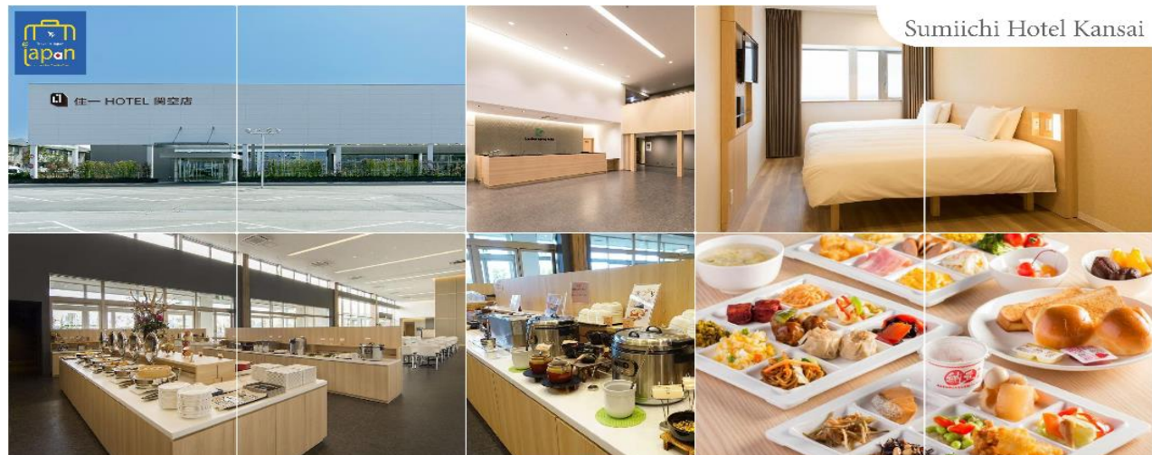
Sumiichi Hotel Kansai