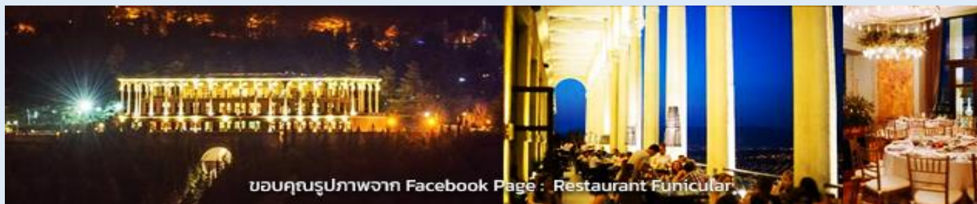
ขอบคุณรูปภาพจาก Facebook Page : Restaurant Funicular

พิเศษ!! กับดินเนอร์สุดหรู อลังการ ณ ภัตตาคารที่ใหญ่ที่สุดหรูหราที่สุดในกรุง ทบิลีซี ที่ตั้งอยู่บนยอดเขา ท่านสามารถที่จะเห็นตัวเมืองทบิลีซีจากมุมสูงได้อย่างชัดเจน ภายในภัตตาคารตกแต่งหรูหราสุดอลังการ พักค้างคืน ที่ Clock Hotel 4 ดาว (Confirmed)