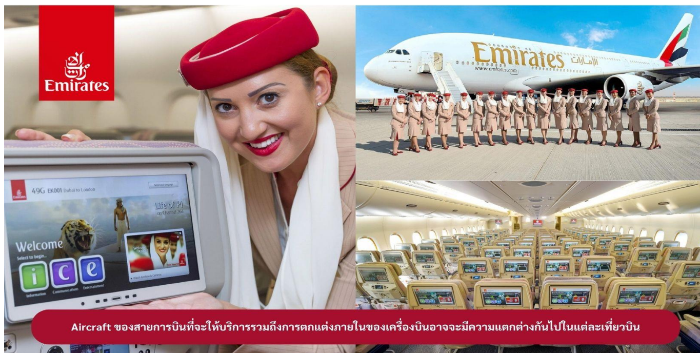
Aircraft ของสายการบินที่จะให้บริการรวมถึงการตกแต่งภายในของเครื่องบินอาจมีความแตกต่างกันไปในแต่ละเที่ยวบิน

23.00 น. ### ขณะเดินทางพร้อมกัน ณ สนามบินสุวรรณภูมิ อาคารผู้โดยสารขาออกระหว่างประเทศ ชั้น 4 ประตู 9 แถว T สายการบินเอมิเรตส์ แอร์ไลน์ (EK) เจ้าหน้าที่ให้การต้อนรับและอำนวยความสะดวก