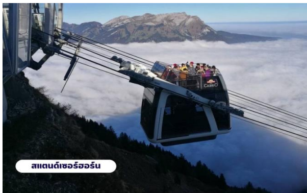
สแตนดาร์ดอร์

ทุกท่านจะสามารถมองเห็นวิวแบบ 360 องศา จากนั้นให้ท่านได้เพลิดเพลินกับความสวยงามของธรรมชาติและทัศนียภาพที่งดงาม