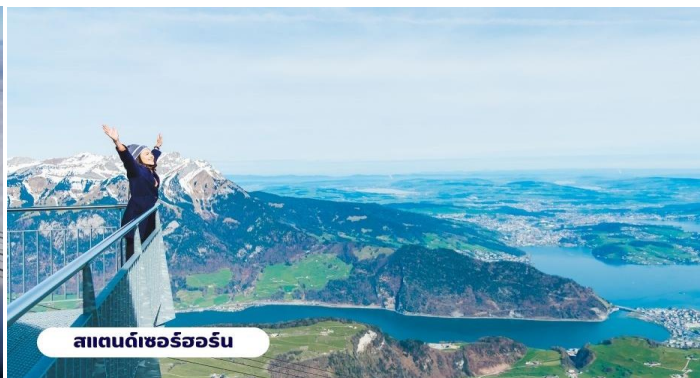
สแตนดาร์ดอร์

เที่ยง ๑๐ บริการอาหารกลางวัน ณ ภัตตาคาร จากนั้นนำท่านเดินทางสู่ เมืองมิลาน (MILAN) ใช้เวลาเดินทางประมาณ 4 ชั่วโมง เมืองสำคัญในภาคเหนือของประเทศอิตาลี ตั้งอยู่ในแคว้นที่ราบลอมบาร์ดีเป็น เมืองที่มีชื่อเสียงในด้านแฟชั่นและศิลปะ ซึ่งมิลานถูกจัดให้เป็นเมืองแฟชั่นในลักษณะเดียวกับ นิวยอร์ก ปารีส ลอนดอน และ โรม