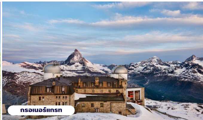
กรอเนอร์โฮส

ถึงเวลาอันสมควรนำท่านเดินทางกลับสู่เมืองเซอร์แมทอีกครั้งโดยรถไฟ อิสระ ท่านเดินเล่นชมเมืองเซอร์แมท เลือกซื้อสินค้าของฝากพื้นเมือง หรือนาฬิกาสวิส อันขึ้นชื่อตามอัธยาศัย สมควรแก่เวลานำท่านขึ้นรถไฟกลับสู่เมืองแทสซ์