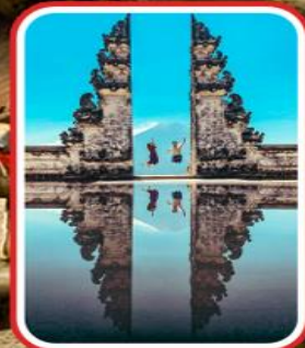
ไฮไลท์แห่งบาหลี ชมประตูวัดเลมปูยางค์