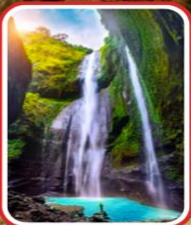
ชมความงดงาม น้ำตกมาดาการ์ปุระ