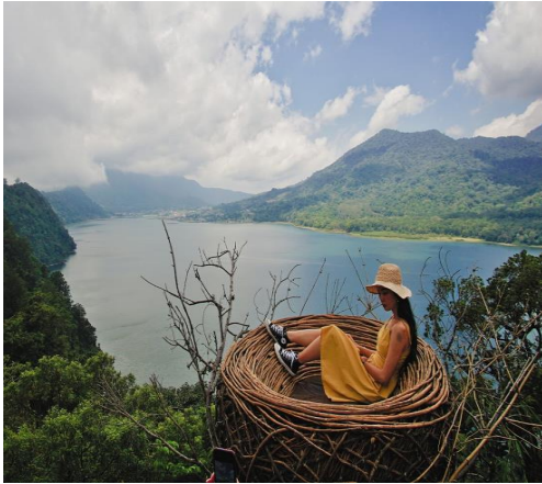
WanagiriHidden Hills Baliสำหรับกิจกรรมการถ่ายภาพ

จากนั้นนำท่านเดินทางสู่ Wanagiri Hidden hill ตั้งอยู่บนทางหลวง Munduk Wanagiri ที่มีความสูงของพื้นที่ภูเขาทางตอนเหนือของเกาะบาหลี เนินเขา และทะเลสาบที่มีความสวยงามเป็นเอกลักษณ์แห่งท้องเที่ยวทางธรรมชาติของ ถือเป็นกิจกรรมน่าสนใจที่ซ่อนอยู่ในบาหลี หนึ่งในนั้นคือการท่องเที่ยวทางธรรมชาติที่น่าทึ่งพร้อมเสน่ห์แห่งความงามที่เหมาะสมสำหรับการพักผ่อนและเซลฟีใน Buleleng Wanagiri Hidden Hills Bali นำเสนอจุดถ่ายภาพที่มีคอนเซ็ปต์มีเสน่ห์ของ