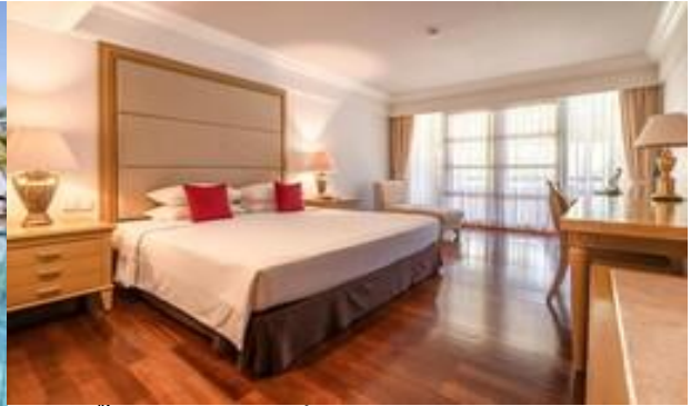
จากนั้นนำท่านเข้าสู่ที่พัก BINTANG BALI หรือ