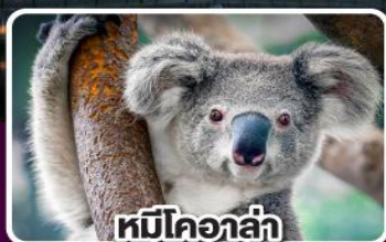
หมีโคอาล่า