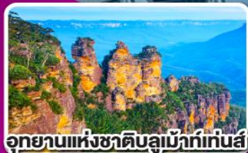
อุทยานแห่งชาติบลูเมาท์เทนส์

พิเศษ เมนูภัตตาคารท่านละ 1 ตัว พร้อมไวน์ชั้นเยี่ยม