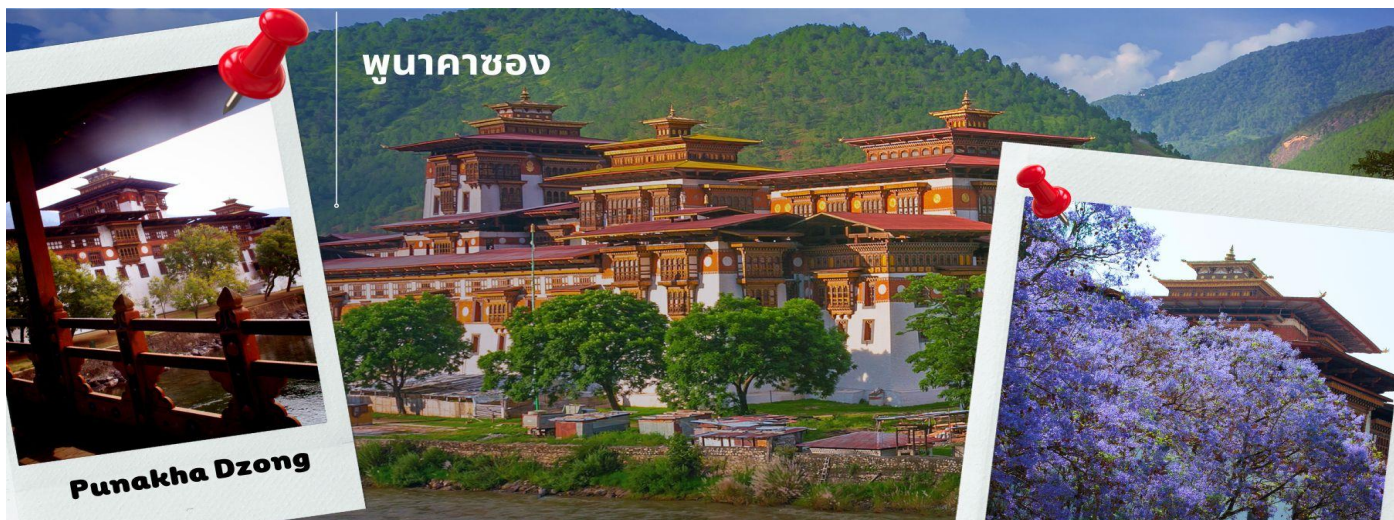
พุนาคาซอง

CB3PBH1 ภูฏาน 5 วัน 4 คืน ภูฏาน แอร์ไลน์ B3 (Nov-Apr 25)