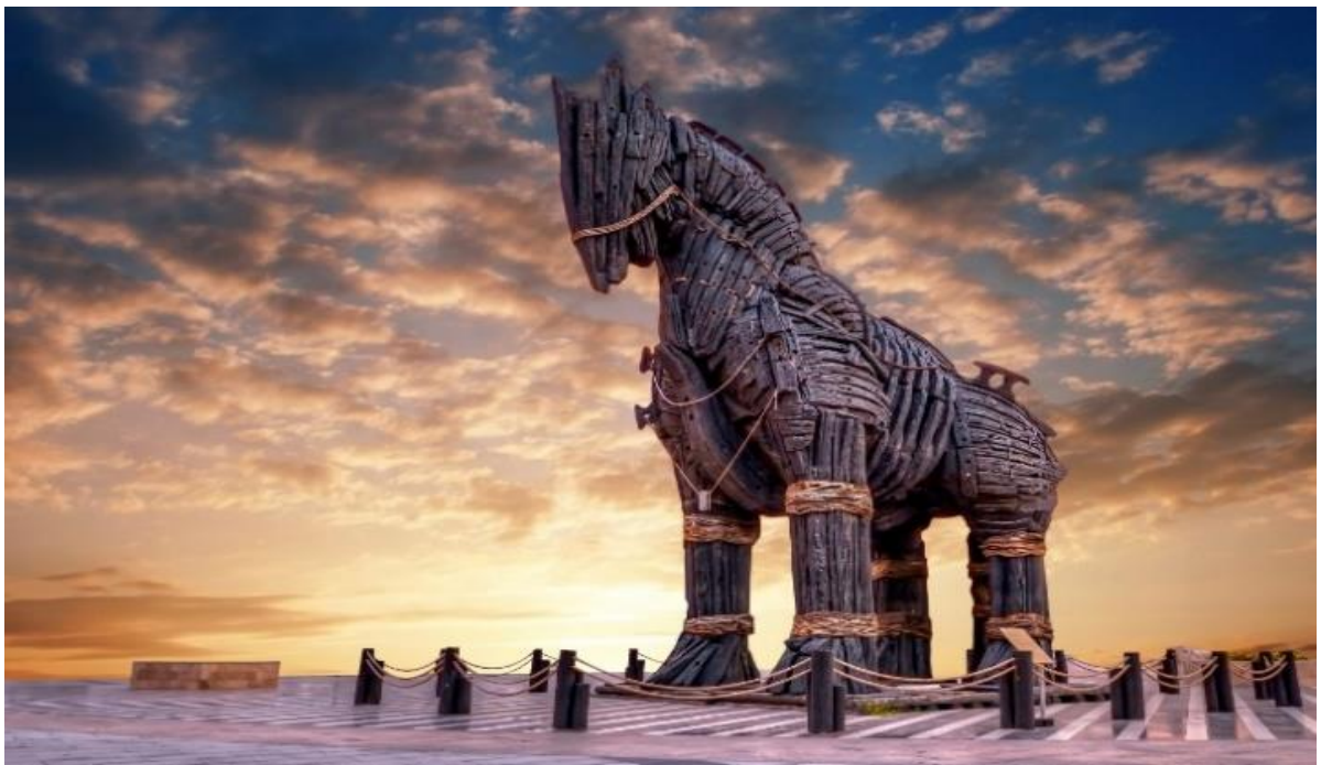
นำท่านชมและถ่ายภาพ ม้าไม้จำลองเมืองทรอยริมทะเล (TROJAN STATUE/HOLLYWOOD HORSE) เป็นม้าไม้ที่มีชื่อเสียงโด่งดังมากที่สุดจากมหากาพย์ภาพยนตร์ฮอลลีวูดเรื่อง ทรอย (Troy) ในปี 2004 มีแบรด