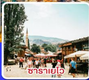
ซาราเยโว