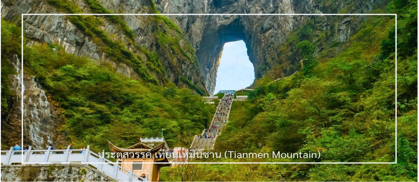
ประตูสวรรค์ เทียนเหมินซาน (Tianmen Mountain)

เสียดฟ้า เมื่อถึงยอดเขาเทียนเหมินซาน นำคณะเดินตามเส้นทางชมวิวเลียบภูเขาและหน้าผา ชมทัศนียภาพจากมุมสูงบนยอดเขา ทำท่ายความกล้าของท่านด้วยการเดินบนพื้นกระจกใสของ ระเบียงแก้ว กระจกใสเลียบหน้าผา จากนั้นนำท่านสู่ ประตูสวรรค์ โดย บันไดเลื่อนที่สร้างขึ้นโดยการเจาะทะลุภูเขาที่เรียงติดต่อกันถึง 5 ตอน เป็นเครื่องอำนวยความสะดวกใหม่ล่าสุดของ เขาเทียนเหมินซาน ท่านจะได้ถ่ายภาพ ประตูสวรรค์ อย่างใกล้ชิด