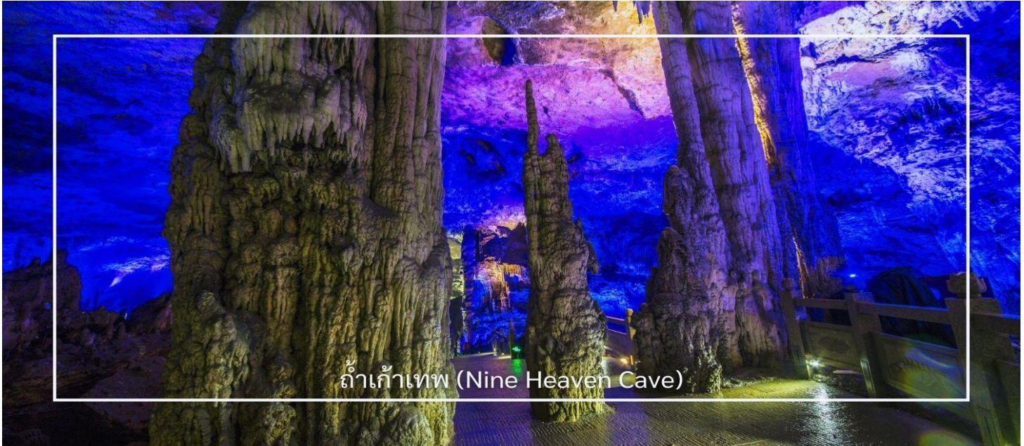
ถ้ำเก้าเทพ (Nine Heaven Cave)

จากนั้นนำท่านเดินทางสู่ ถ้ำเก้าเทพ (Nine Heaven Cave) ที่นับเป็นหนึ่งในถ้ำที่มีขนาดใหญ่และสวยงามที่สุดแห่งหนึ่งของภูมิภาค ภายในถ้ำเต็มไปด้วยหินงอกหินย้อยรูปร่างแปลกตา เกิดจากการสะสมตัวของแร่ธาตุตามธรรมชาติยาวนานนับล้านปี โถงถ้ำมีความกว้างใหญ่โอ่อ่า เพดานสูง และมีการจัดแสงสีอย่างสวยงาม ช่วยขับเน้นความอลังการของชั้นหินให้ดูโดดเด่นราวกับดินแดนสวรรค์ใต้พิภพ บรรยากาศภายในเย็นสบายตลอดทั้งปี