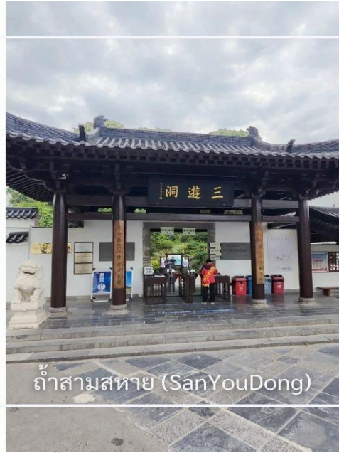
ถ้ำสามสหาย (SanYouDong)