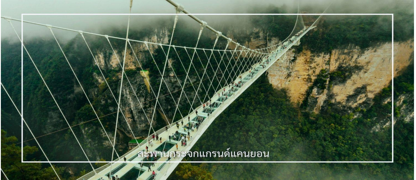
สะพานกระจกแกรนด์แคนยอน

สัมผัสประสบการณ์สุดตื่นเต้นกับการเดินบนสะพานกระจกใส ที่ทอดยาวเหนือหุบเขาสูง ให้ท่านได้ชมทัศนียภาพอันงดงามแบบพาโนรามา พร้อมทั้งท้าทายความกล้าท่ามกลางบรรยากาศธรรมชาติอันยิ่งใหญ่