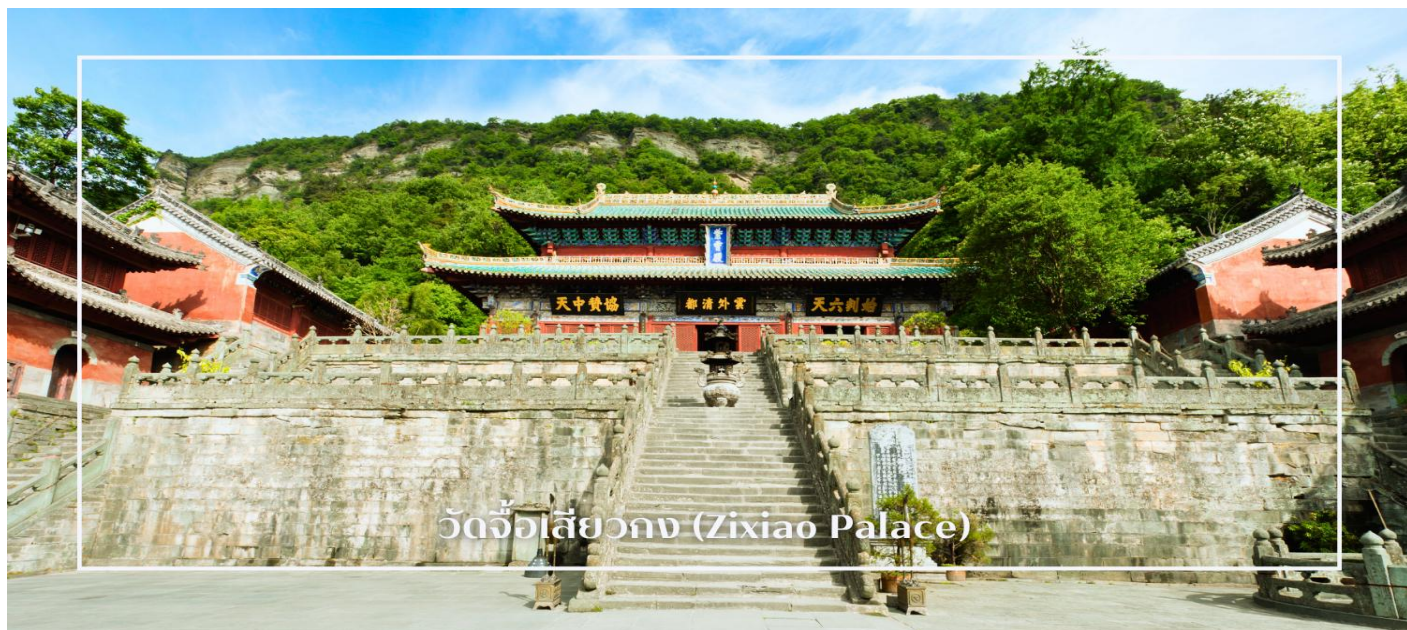
วัดจื่อเสี่ยวกง (Zixiao Palace)