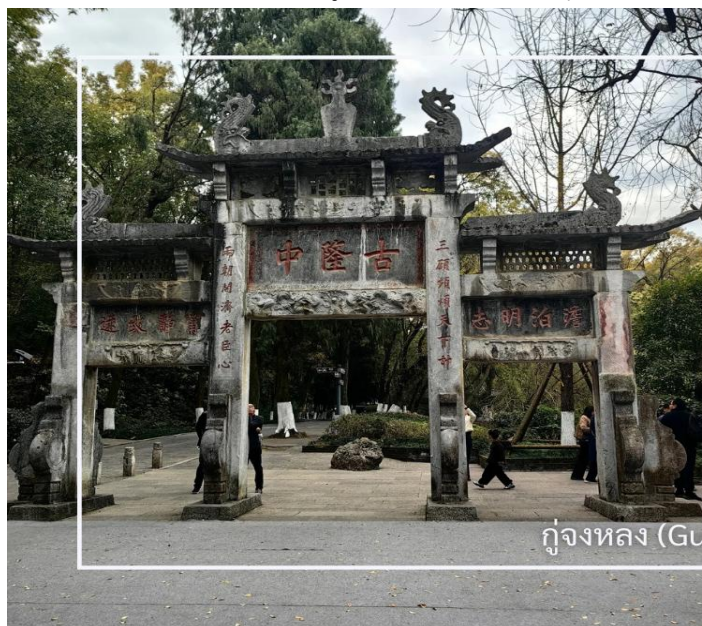
กู่หลงจง (Gulongzhong)

หลังอาหารเช้านำท่านสู่ กู่หลงจง (Gulongzhong) แหล่งท่องเที่ยวทางประวัติศาสตร์และวัฒนธรรมที่มีชื่อเสียง ตั้งอยู่ใกล้เมืองเซียงหยาง เป็นสถานที่พำนักของ จูกัดเหลียง (ขงเบ้ง) นักปราชญ์และนักยุทธศาสตร์ผู้ยิ่งใหญ่แห่งยุคสามก๊ก สถานที่แห่งนี้ในอดีตคือสถานที่ที่เล่าปีได้เดินทางมาพบกับจูกัดเหลียงที่เชิญตัวไปร่วมทัพ ปัจจุบันสถานที่นี้โอบล้อมด้วยธรรมชาติ สะท้อนบรรยากาศแห่งการศึกษา และวางแผนการเมืองในอดีต พร้อมให้ท่านได้เรียนรู้เรื่องราวทางประวัติศาสตร์อันทรงคุณค่า พร้อมสัมผัสบรรยากาศที่เชื่อมโยงกับตำนานและภูมิปัญญาจีนโบราณ จึงนับเป็นจุดหมายสำคัญสำหรับผู้สนใจประวัติศาสตร์ยุคสามก๊ก และวัฒนธรรมจีน