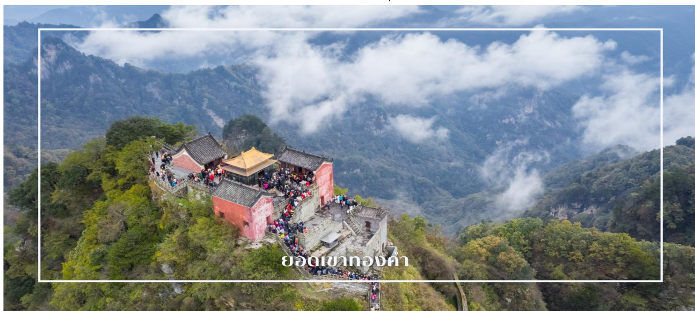
ยอดเขากงค่า

ยอดเขาทองคำ หรือ จินต้ง (Jinding) เป็นจุดสูงสุดและศูนย์กลางอันศักดิ์สิทธิ์ของภูเขาอู่ต้งซาน แหล่งรวมศรัทธาแห่งลัทธิเต๋าที่มีความสำคัญสูงสุดแห่งหนึ่งของประเทศจีน บนยอดเขาประดิษฐานวิหารทองคำ ซึ่งสร้างขึ้นในสมัยราชวงศ์หมิง มีความงดงามและโดดเด่นด้วยสถาปัตยกรรมอันประณีต สะท้อนความรุ่งเรืองทางศิลปะและความเชื่อในอดีต ท่านสามารถชื่นชมทัศนียภาพของเทือกเขาอู่ต้งซานที่ทอดยาวสลับซับซ้อน ท่ามกลางทะเลหมอกอันงดงาม ที่นี่เป็นจุดหมายสำคัญที่ผสมผสานความศักดิ์สิทธิ์ ความงามของธรรมชาติ และคุณค่าทางประวัติศาสตร์ไว้อย่างลงตัว