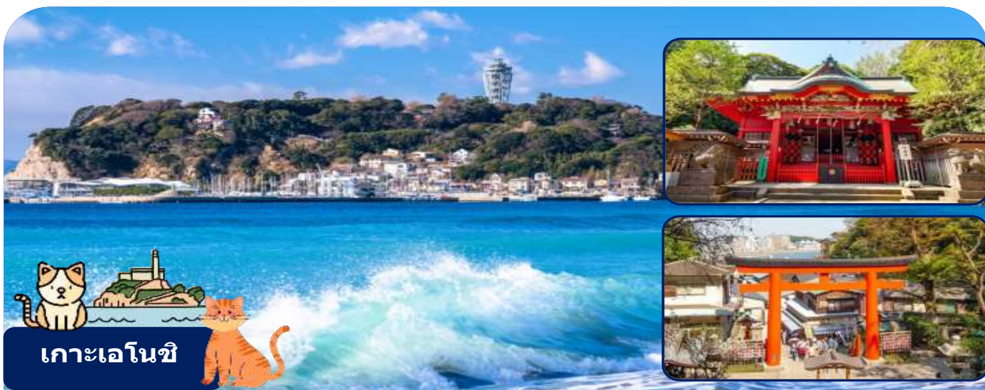
เกาะเอโนชิ

นำท่านเดินทางสู่เมืองคามาคุระ จังหวัดคางาวะ เมืองประวัติศาสตร์ที่ขึ้นชื่อเรื่องวัดวาอารามและวิวทะเลสดโรแมนติก ให้ท่านได้สัมผัสกลิ่นอายญี่ปุ่นแบบดั้งเดิมผสมผสานกับความสงบของธรรมชาติ