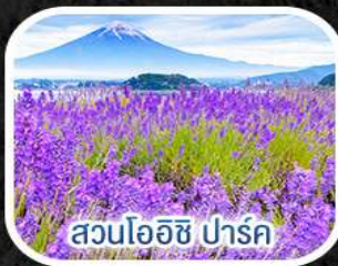
สวนไออิชิ ปาร์ค