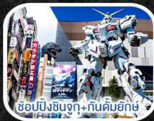
ช้อปปิ้งชินจูกุ+กันดั้มยักษ์