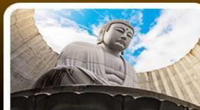
เนินเขาแห่งพระพุทธรเจ้า