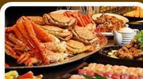
บุฟเฟ่ต์ชาบู+วาปู 3 ชนิด