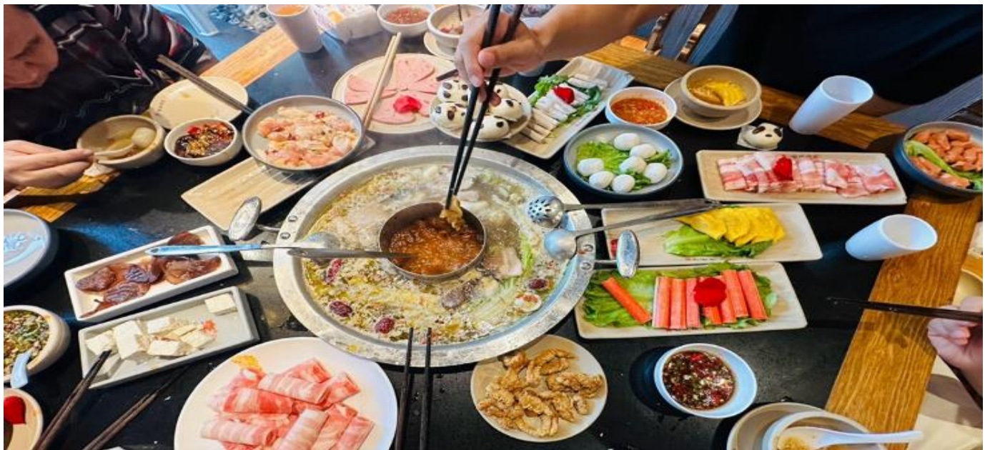
คำ รับประทานอาหารคำ ณ ภัตตาคาร (มื้อที่ 12) *เมนูพิเศษสุกี้หม่าล่าเสฉวน