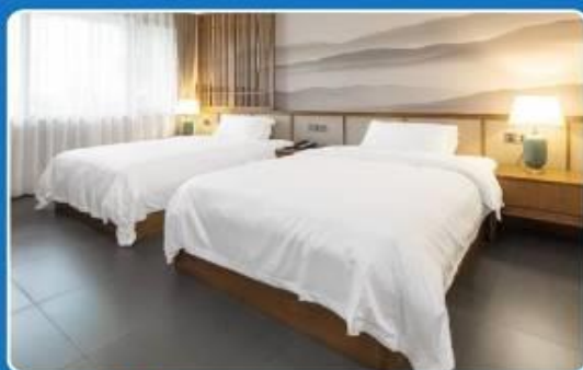
👤👤 TWIN (TWN)