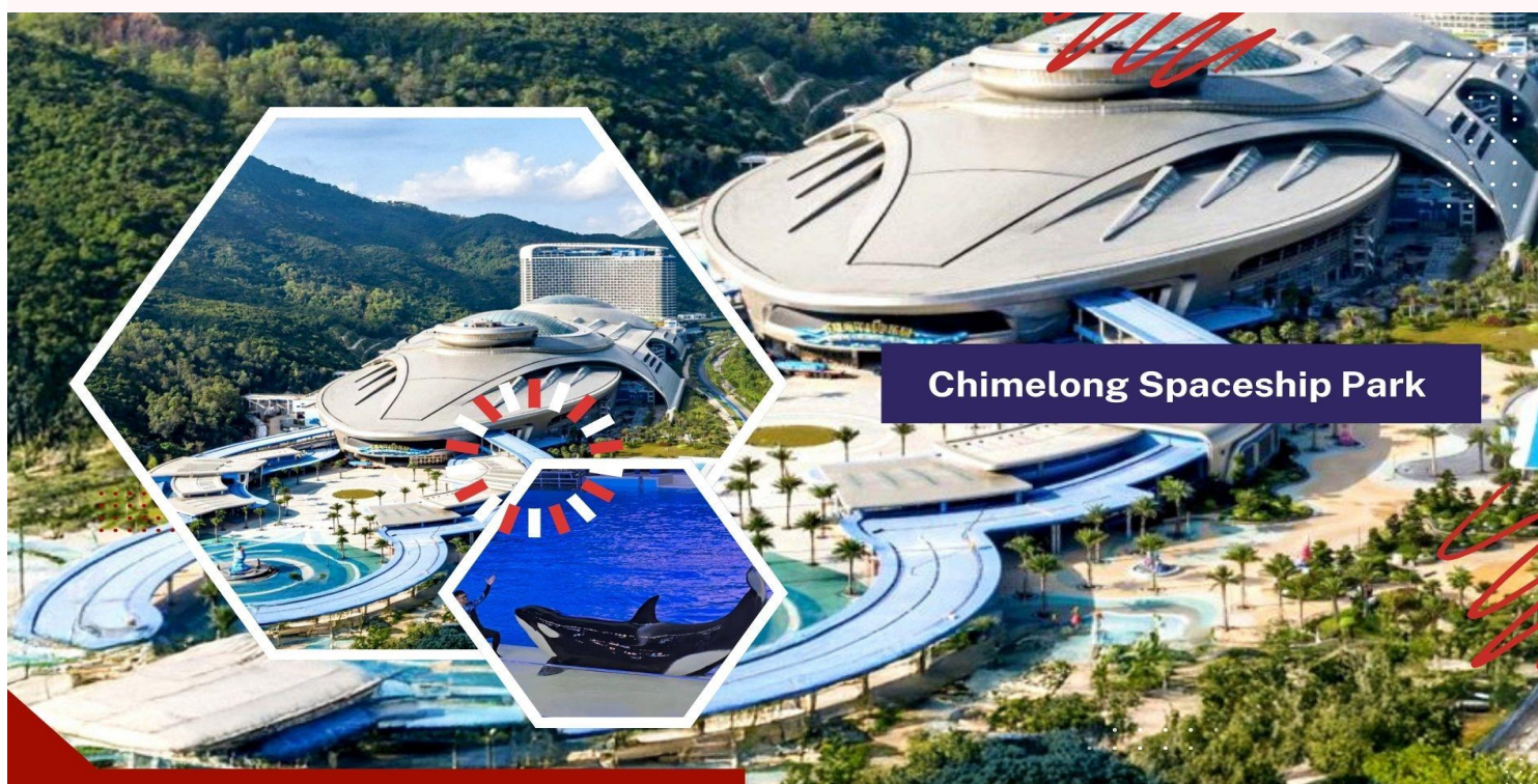
Chimelong Spaceship Park

** อีศระอาหารเที่ยง และอาหารค่ำ เพื่อไม่ให้เป็นการเสียเวลาในการท่องเที่ยว **