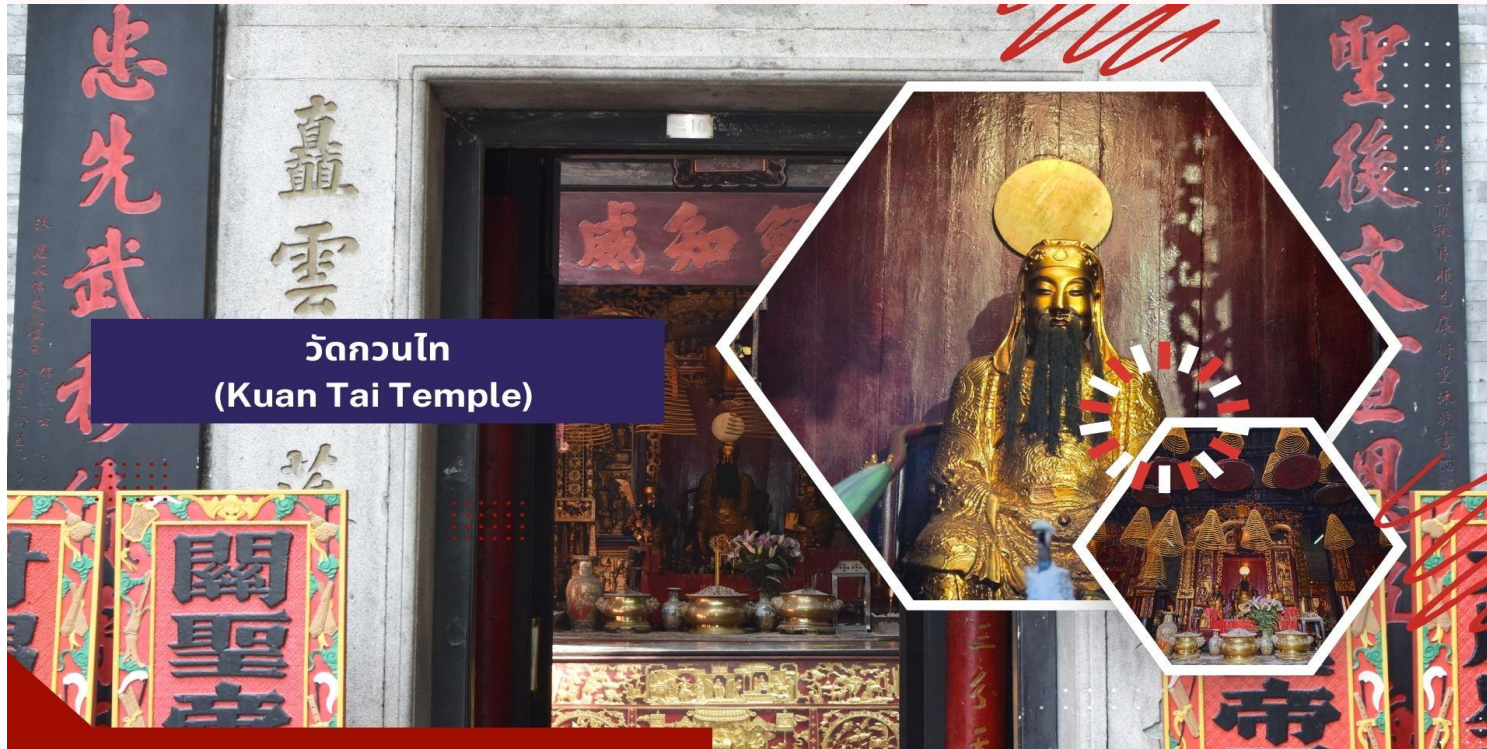
วัดกวนไท (Kuan Tai Temple)

นำท่านเดินทางสู่ วัดกวนไท (Kuan Tai Temple) หรือรู้จักกันในชื่อ วัดซาไกวยคุน (Sam Kai Vui Kun Temple) เป็นวัดที่มีความสำคัญทางประวัติศาสตร์และวัฒนธรรมในมาเก๊า ได้รับการขึ้นทะเบียนเป็นมรดกโลกของ UNESCO ร่วมกับศูนย์กลางประวัติศาสตร์มาเก๊าในปี ค.ศ. 2005 เนื่องจากคุณค่าทางประวัติศาสตร์ สถาปัตยกรรม และวัฒนธรรมที่โดดเด่น ตั้งอยู่ใจกลางจัตุรัสเซนาโด้และรายล้อมไปด้วยอาคารสไตล์ยุโรป วัดนี้สร้างขึ้นเมื่อปี ค.ศ. 1750 และเป็นที่ประดิษฐานของเทพเจ้ากวนอู ซึ่งเป็นเทพเจ้าแห่งความมั่งคั่งและปกป้องคุ้มครอง วัดแห่งนี้มีเป็นที่นิยมของผู้ทำธุรกิจ ตำรวจ และนักการเมือง เพราะเชื่อว่าสามารถปกป้องสิ่งชั่วร้ายต่างๆ และช่วยเสริมอำนาจบารมีในการปกครองและคุ้มครองบริวาร