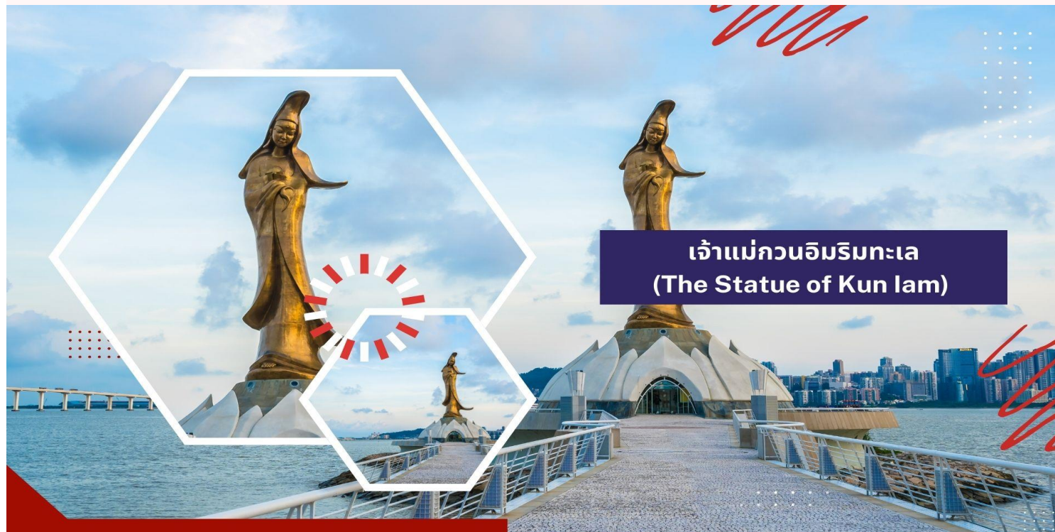
เจ้าแม่กวนอิมริมทะเล (The Statue of Kun lam)

นำท่านชม เจ้าแม่กวนอิมริมทะเล (The Statue of Kun lam) เจ้าแม่กวนอิมปรากฏองค์ทองสร้างด้วยทองสัมฤทธิ์ทั้งองค์ มีความสูง 18 เมตร หนักกว่า 1.8 ตัน ประดิษฐานอยู่บนฐานดอกบัวดูงดงามอ่อนช้อย สะท้อนกับแดดเป็นประกายเรืองรองเหลืองอร่ามงดงาม จับตา เจ้าแม่กวนอิมองค์นี้เป็นเจ้าแม่กวนอิมลูกครึ่ง คือ บั้นเป็นองค์เจ้าแม่กวนอิมแต่กลับมีพระพักตร์เป็นหน้าพระแม่มาริที่เป็นเช่นนี้ก็เพราะว่าเป็นเจ้าแม่กวนอิมโพตุเกสตั้งใจสร้างขึ้นเพื่อเป็นอนุสรณ์ให้กับมาเก๊าในโอกาสที่ส่งมอบมาเก๊าคืนให้กับจีน