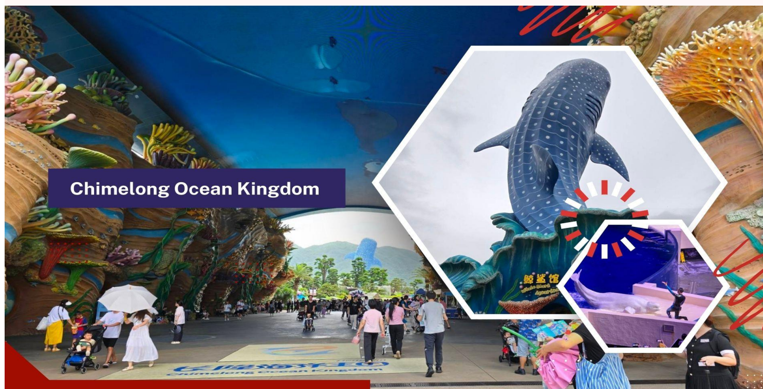
Chimelong Ocean Kingdom

** อิสระอาหารเที่ยง และอาหารค่ำ เพื่อไม่ให้เป็นภาระเสียเวลาในการท่องเที่ยว **