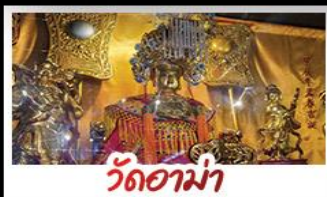
วัดอาเมา

จุฬาราชมนตรี โรงละครหอไอศุก วิหารเซนต์ปอล วัดกวนโถ ขอพรเทพเจ้ากวนอูช่วยเสริมอำนาจบารมี เจ้าแม่กวนอิมริมทะเล วัดอาเมา ขอพรเรื่องการเดินทาง