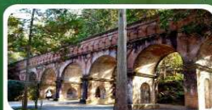
วัดนินเซ็นจิ