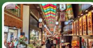
ตลาดปลาชิชิ