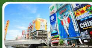
ช้อปปิ้งย่านชินไซบาชิ