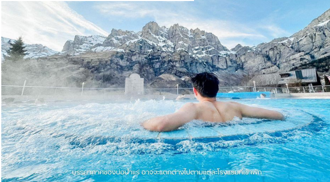
บรรยากาศของบ่อน้ำแร่ อาจจะแตกต่างกันไปตามแต่ละโรงแรมที่เข้าพัก

บรรยากาศบ่อน้ำแร่ เมืองลวยเคอร์บาร์ด บรรยากาศจริงจะมีความแตกต่างไปในแต่ละฤดูกาลที่เกี่ยวข้อง