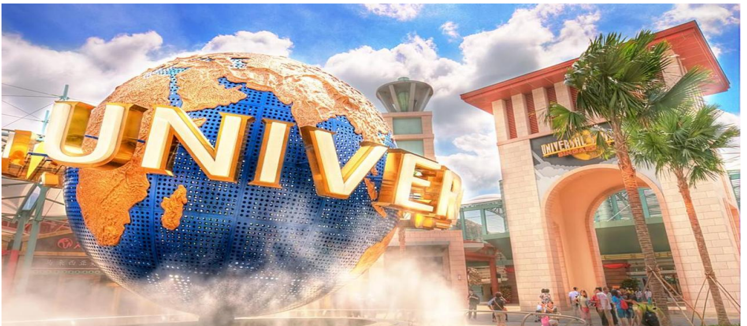
Universal Studios Singapore เป็นสวนสนุกที่ตั้งอยู่ใน Resorts World Sentosa ที่ Sentosa ประเทศสิงคโปร์ มีเครื่องเล่น การแสดง และสถานที่ ท่องเที่ยว 28 แห่ง ในเจ็ดโซนที่มีธีม เป็นหนึ่งในหกสวนสนุก Universal Studios ทั่วโลก