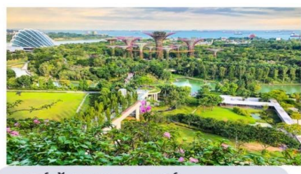
การ์เด็น บาย เดอะเบย์