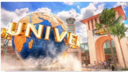
ยูนิเวอร์แซล สตูดิโอ