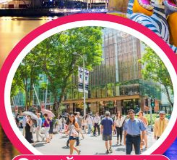
📍 ซุปเปอร์มาร์เก็ต