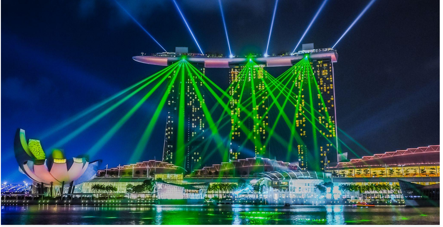
ชมโชว์การแสดงม่านน้ำ แสง สี เสียง เป็นการแสดงน้ำพุ ไฟ แสง และเลเซอร์สุดอลังการ