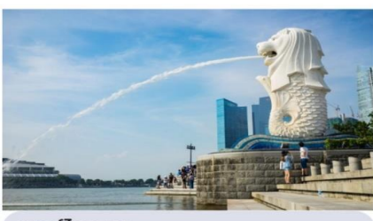
เมอร์ไลออน