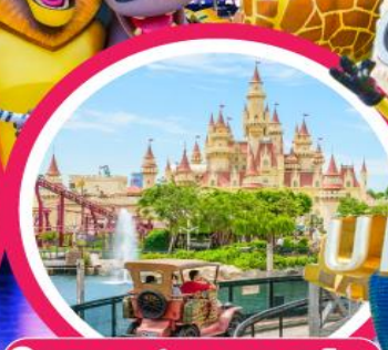
📍 ยูนิเวอร์แซล สตูดิโอ