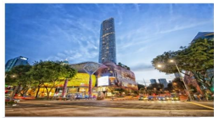
ซ้อปปีงออร์ชาร์ด