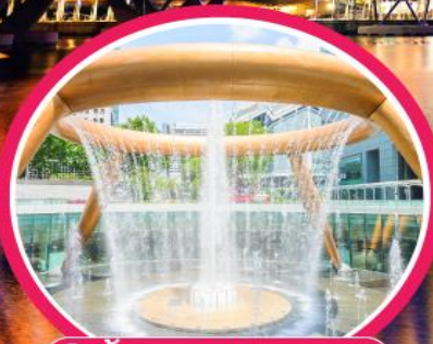
📍 น้ำพุแห่งโซคลาก