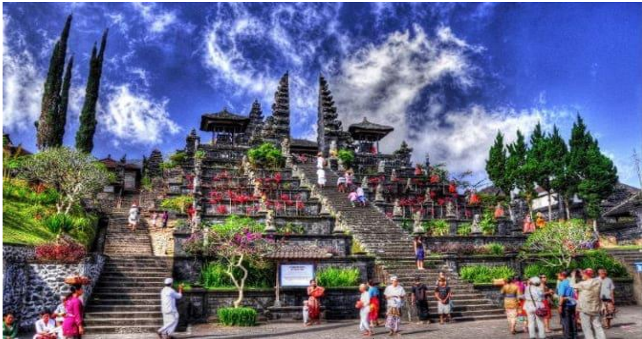
**** หากมีการแจ้งเดือนกัญญาเขาไฟ ขอสงวนสิทธิ์ในการปรับเปลี่ยนวัดบาตุร์แทน ****