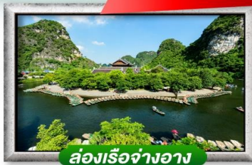
ล่องเรือจางอาน