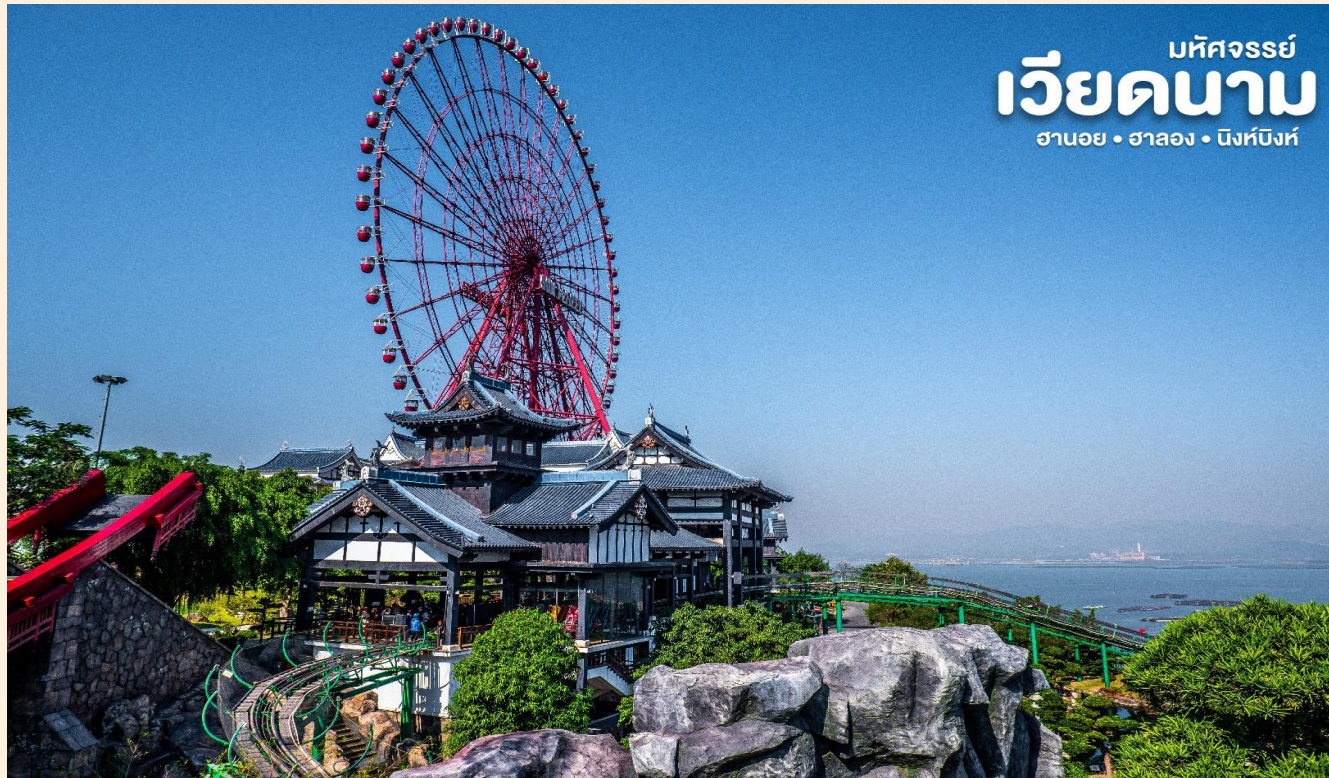
มหัศจรรย์ เวียดนาม ฮานอย • ฮาลอง • นิงห์บิงห์

** ชำระค่าทัวร์ในนามบริษัท ไลออน ทราเวล จำกัด เท่านั้น **