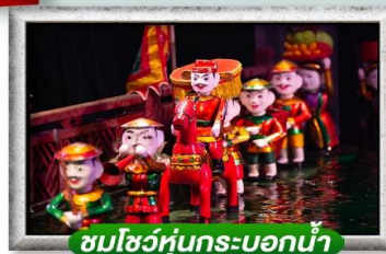
ชมโชว์หุ่นกระบอกน้ำ