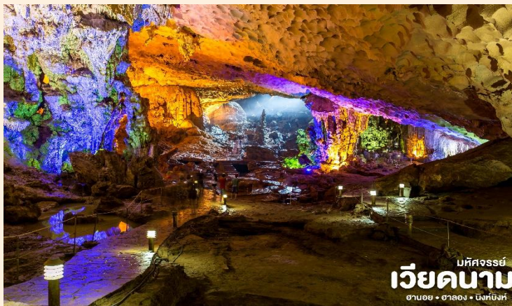
มหัศจรรย์ เวียดนาม ฮานอย • ฮาลอง • นิงห์บิงห์

📍 นำท่าน ชม ถ้ำสวรรค์ ชมหินงอกหินย้อยมากมายล้วนแต่สวยงามและน่าประทับใจยิ่งนัก ถ้ำแห่งนี้เพิ่งถูกค้นพบเมื่อไม่นานมานี้ได้มีการประดับแสงสีตามผนังและมุมต่างๆในถ้ำซึ่งบรรยากาศภายในถ้ำท่านจะชมความสวยงามตามธรรมชาติที่เสริมเติมแต่งโดยมนุษย์ นำท่านชมเกาะไก่อูบกัน ซึ่งถือว่าเป็นสัญลักษณ์ของอ่าวฮาลองลักษณะจะเป็นเกาะเล็กๆ 2 เกาะหันหน้าเข้าหากันคล้ายๆกับไก่อูหรือนกแล้วแต่จินตนาการของแต่ละท่าน