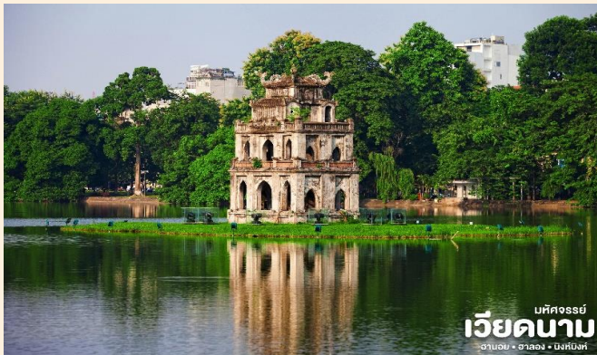
บห์คองฮง เวียดนาม ฮานอย • ฮาลอง • นิงห์บิงห์

📍 นำท่านชมทะเลสาบคินดาบ ทะเลสาบใจกลางเมืองฮานอย ทะเลสาบแห่งนี้มีตำนานกล่าวว่า ในสมัยที่เวียดนามทำสงครามสู้รบกับประเทศจีน แต่ยังไม่สามารถเอาชนะทหารจากจีนได้สักที ทำให้เกิดความท้อแท้พระทัย เมื่อได้มาล่องเรือที่ทะเลสาบแห่งนี้ ได้มีเต่าขนาดใหญ่ตัวหนึ่งได้คาบดาบวิเศษมาให้พระองค์ เพื่อทำสงครามกับประเทศจีนหลังจากที่พระองค์ได้รับดาบมานั้น พระองค์ได้กลับไปทำสงครามอีกครั้ง และได้รับชัยชนะเหนือประเทศจีน ทำให้บ้านเมืองสงบสุข เมื่อเสร็จศึกสงครามแล้ว พระองค์ได้นำดาบมาคืน ณ ทะเลสาบแห่งนี้