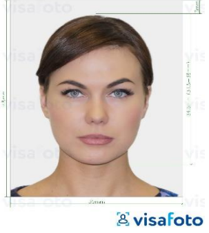
คุณสมบัติรูปถ่าย

2.รูปถ่ายสี ฉากหลังเป็นสีขาวเท่านั้น ขนาด กว้าง 3.5 ซม. สูง 4.5 ซม. จำนวน 3 รูป (ถ่ายไม่เกิน 6 เดือน) หน้าตรง ห้ามสวมแว่นตาหรือเครื่องประดับ ไม่ใส่คอนแทคเลนส์ ไม่ยิ้มเห็นฟัน ขึ้นอยู่กับประเทศที่จะเดินทาง ภาพถ่ายจะต้องครอบคลุมถึงศีรษะ และด้านบนของหัวไหล่ โดยต้องเห็นใบหน้าอย่างชัดเจน เห็นหน้าผากและใบหูชัดเจน