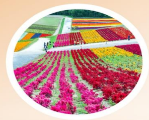
SUMMER มิถุนายน-สิงหาคม 16 °C - 22 °C