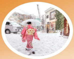
WINTER ธันวาคม-กุมภาพันธ์ -20°C - 5°C