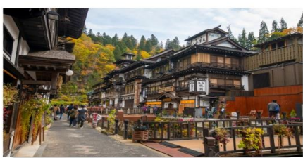
หมู่บ้านกินชอนออนเซ็น