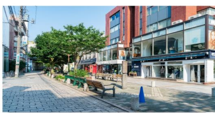
ย่านชมนหวานจียูกาโอกะ