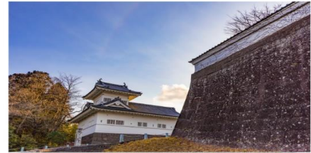
ปราสาทเซนได