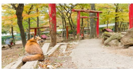
หมู่บ้านสุนัขจิ้งจอก