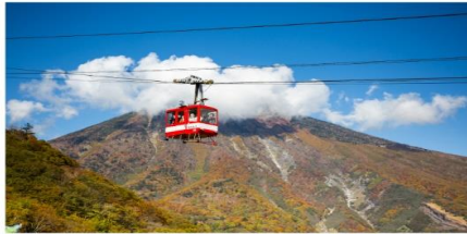
กระเช้าลอยฟ้าอะเคจิโตระ