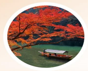
AUTUMN กันยายน-พฤศจิกายน 5 °C - 20 °C