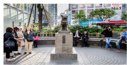
รูปปั้นสุนัขฮาจิโกะ