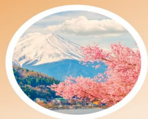
SPRING มีนาคม-พฤษภาคม 4 °C - 15 °C