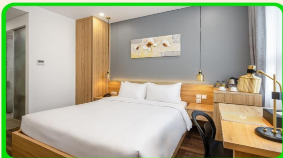
พักเมืองดานัง 4 ดาว 3 คืน