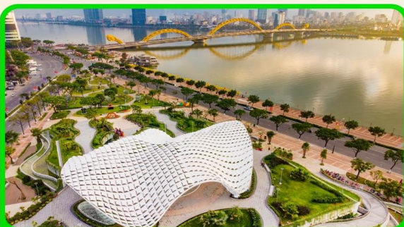
เช็คอิน แหล่งที่เก๋ใหม่ APEC PARK