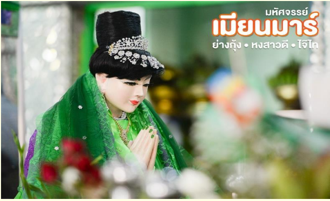
จากนั้น นำทำนชมและนมัสการ พระมหาเจดีย์ชเวดากอง(Shwedagon Pagoda)