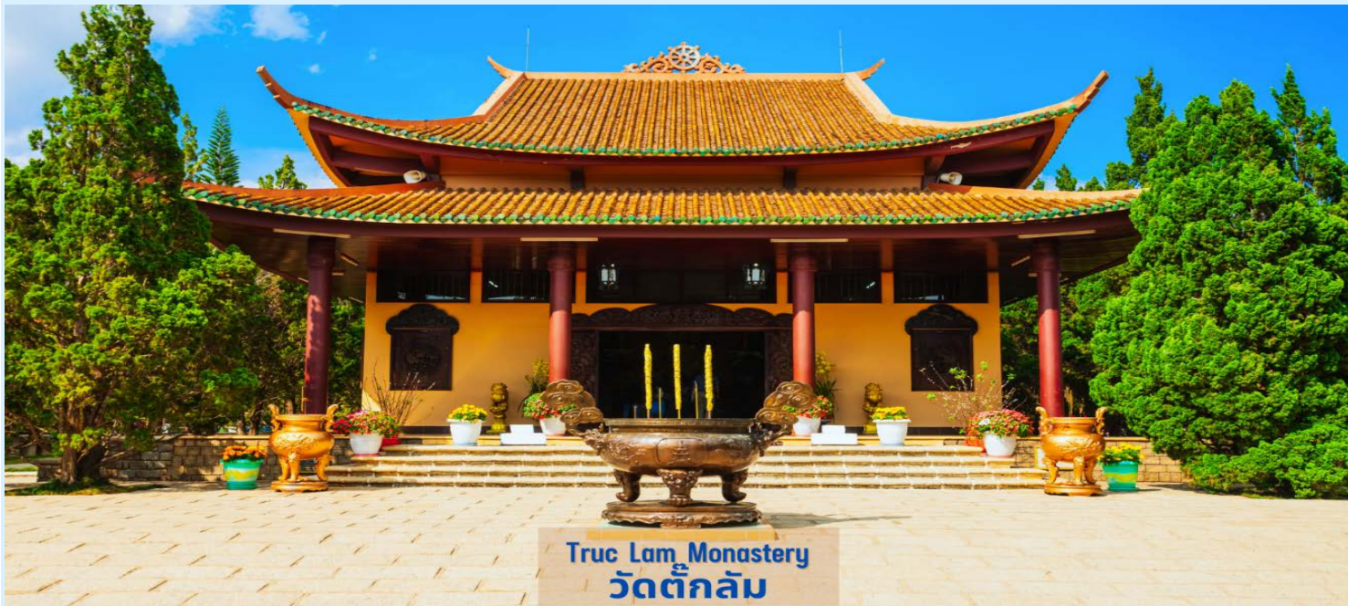
Truc Lam Monastery วัดตักล้ม

นำท่าน นั่งกระเช้า เพื่อเข้าไปเที่ยวชม วัดตักล้ม (Truc Lam Monastery) เป็นวัดพุทธในนิกายเซน แบบญี่ปุ่น ตั้งอยู่บนเทือกเขาเฟื่องฮว่าง ภายในบริเวณวัดนอกจากจะมีสิ่งก่อสร้างที่สวยงาม สะอาด เป็นระเบียบเรียบร้อยแล้ว ยังมีการจัดทัศนียภาพโดยรอบด้วยสวนดอกไม้ที่ผลิดอกบานสะพรั่ง นับได้ว่าเป็นวิหารซึ่งเป็นที่นิยมและงดงามที่สุดในดาลัด