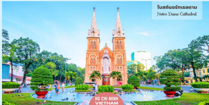
โบสถ์นอร์เทอดาม Notre Dame Cathedral