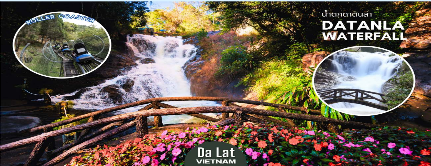
น้ำตกดาตันลา DATANLA WATERFALL

นำท่านสัมผัสประสบการณ์สุดตื่นเต้นโดยการ นั่งรถราง (Roller Coaster) ผ่านผืนป่าอันร่มรื่นเขียวชอุ่มลงสู่หุบเขาเบื้องล่าง เพื่อชมและสัมผัสกับความสวยงามของ น้ำตกดาตันลา (Datanla Waterfall) อยู่ห่างจากตัวเมืองดาลัดไปทางทิศใต้ประมาณ 5 กิโลเมตร เป็นน้ำตกไม่ใหญ่มากแต่มีความสวยงาม น้ำตกแห่งนี้จะเป็นน้ำตกที่มีน้ำตกต่อเนื่องมาเยื้องมากที่สุดและไม่ควรพลาดในการมาเที่ยวชม (ราคาทัวร์รวมบริการนั่งรถรางโรลเลอร์โคสเตอร์แล้ว)