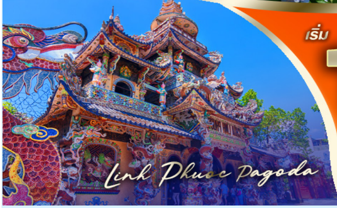
Link Phuoc Pagoda