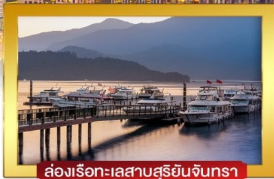
ส่องเรือทะเลสาบสุริยจันทร์