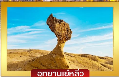
อุทยานเย่หลิว