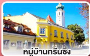
หมู่บ้านกรีนซิง