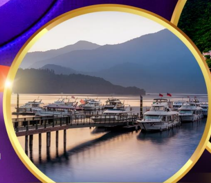
ล่องเรือทะเลสาบสุริยจันทร์