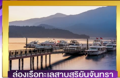
ล่องเรือทะเลสาบสุริยันจันทรา