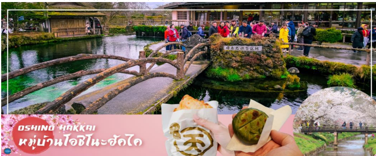
OSHINO HAKKAI หมู่บ้านโอชิโนะฮักไค

นำท่านเดินทางสู่ หมู่บ้านโอชิโนะฮักไค (Oshino Hakkai) ให้ท่านเจาะลึกตามหาแหล่งน้ำบริสุทธิ์จากภูเขาไฟฟูจิ ที่เป็นแหล่งน้ำตามธรรมชาติตั้งอยู่ในหมู่บ้านโอชิโนะ จ.ยามานาชิ หรือพูดในทางกลับกันคือกลุ่มน้ำผุดโอชิโนะฮักไค เพียงก้าวแรกที่ย่างเท้าเข้าไปในหมู่บ้านก็สัมผัสได้ถึงอากาศบริสุทธิ์ และไอเย็นจากแหล่งน้ำธรรมชาติที่มีให้เห็นอยู่ทุกมุม โดยในบ่อน้ำใสแจ้วมีปลาหลากหลายพันธุ์แหวกว่ายอย่างสบายอารมณ์ แต่ขอบอกเลยว่าน้ำแต่ละบ่อนั้นเย็นจับใจจนแอบสงสัยว่าน้องปลาไม่หนาวสะท้านกันบ้างหรือ เพราะอุณหภูมิในน้ำเฉลี่ยอยู่ที่ 10-12 องศาเซลเซียส นอกจากชมแล้วก็มีน้ำผุดจากธรรมชาติให้ดื่มตามอรัยาศัย และที่สำคัญ หมู่บ้านโอชิโนะยังเป็นแหล่งช้อปปิ้งสินค้าโอท็อปชั้นเยี่ยมอีกด้วย