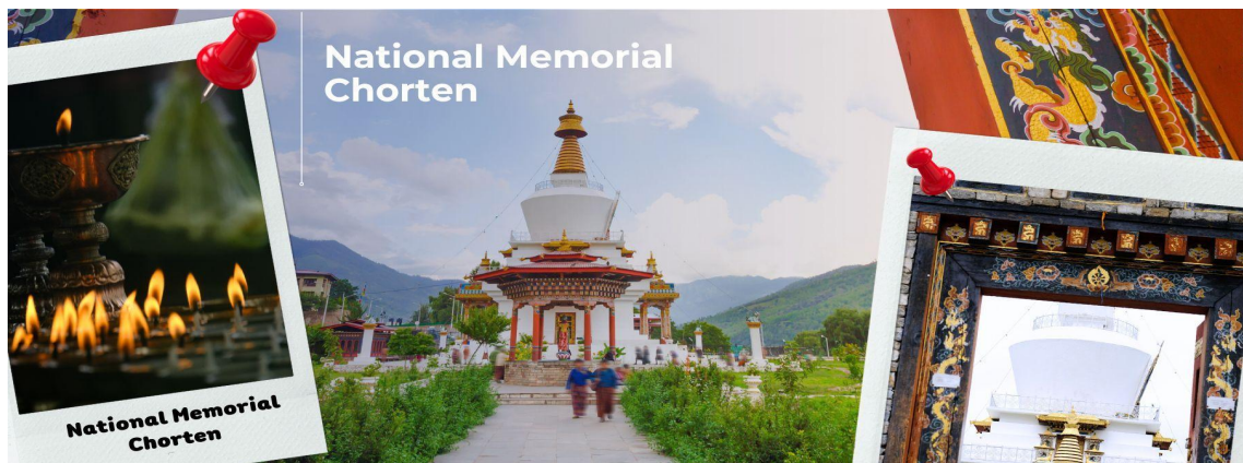
National Memorial Chorten

เช้า รับประทานอาหารเช้า ณ โรงแรมที่พัก (มื้อที่ 3) นำท่านชม National Memorial Chorten อนุสรณ์มหาสถานแด่กษัตริย์รัชกาลที่ 3 แห่งประเทศภูฏานสร้างในปี ค.ศ.1974 มีผู้คนมากมายเดินทางมาแสวงบุญและสวดมนต์ประกอบพิธีกรรมทางศาสนาต่างๆ