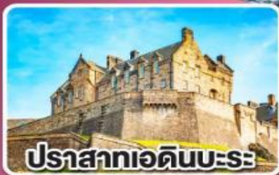
ปราสาทเอдинบะระ