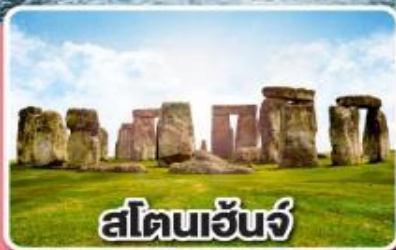
สโตนเฮ็นจ์

พักคอนดอน 3 คืน พร้อมอิสระเที่ยวคอนดอน เต็มอิ่ม 1 วัน