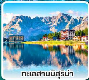
ทะเลสาบมิสุริน่า

เข้าชมมหาวิหารเซนต์ปีเตอร์ ที่ใหญ่ที่สุดในโลกแห่งนครวาติกัน