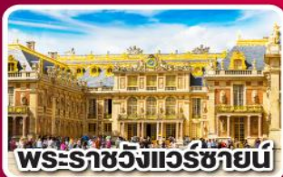
พระราชวังแวร์ซายน์