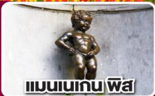
แมนเนเกน ฟิส