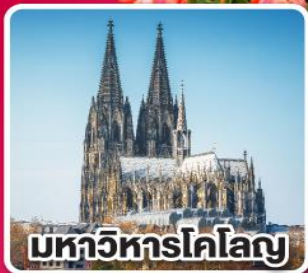
มหาวิหารโคโลญ

เที่ยวเก็บครบ เบนลักซ์ เบลเยียม เนเธอร์แลนด์ และลักเซมเบิร์ก