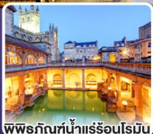
พิพิธภัณฑ์น้ำแร่ร้อนโรมัน

ตื่นตาตื่นใจ กับเสาหินสโตนเฮนจ์ 1 ใน 7 สิ่งมหัศจรรย์ของโลก