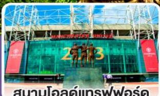
สนามโอลด์แทรฟฟอร์ด