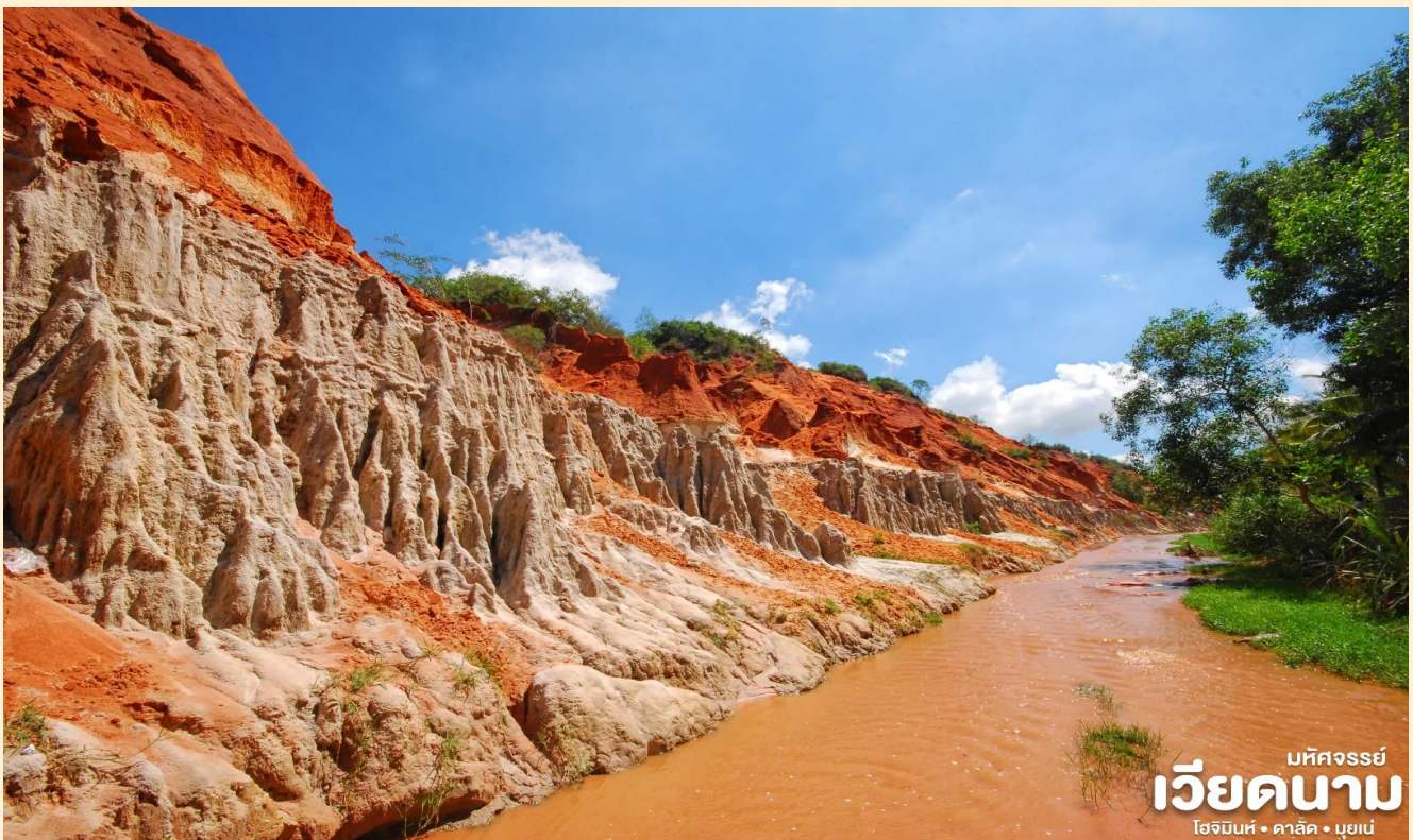
มหัศจรรย์ เวียดนาม โฮจิมินห์ • ดาลัด • มุยเน่

พาท่านชม ลำธารนางฟ้า Fairy Stream ลำธารน้ำสายเล็กๆที่ไหลลัดเลาะผ่านโตรกหน้าผาไปยังทะเล ดินในบริเวณลำธารที่น้ำไหลผ่านไปมีลักษณะเนื้อละเอียดเป็นดินสีแดงอมส้ม ตัดกับเมฆขาว