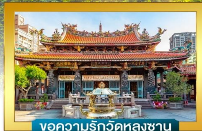
ขอความรักวัดหลงซาน