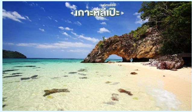
มหัทจรรย์..เกาะหลีเป๊ะ ทะเลสุดปัง ดำน้ำดูที่สวยของปะการังเมืองไทย - หน้า 2 -

จากนั้น แวะชม เกาะไข เกาะเล็กๆ ในอุทยานแห่งชาติตะรุเตา เส้นโค้งของเกาะไขอยู่ตรงประติมากรรมธรรมชาติอย่างข้มประตูลิ้นอันเป็นสัญลักษณ์ของอุทยานแห่งชาติตะรุเตา ทางด้านทิศตะวันตกของเกาะมีหาดทรายสีขาวนวลและละเอียด น้ำทะเลใสสีมรกตเห็น