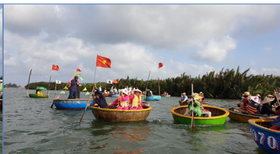
GO1CNXDAD-FD003 ไปแล้วกันเด้อะ บินตรง...เชียงใหม่ ดานัง ฮอยอัน บานาฮิลล์ (นอนบนบานาฮิลล์ 1 คืน) 3 วัน 2 คืน (FD)

** ชำระค่าทัวร์ในนามบริษัท ไลออน ทราเวล จำกัด เท่านั้น **