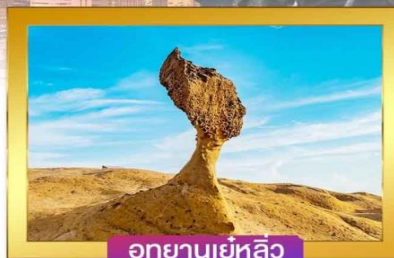
อุทยานเย่หลิว