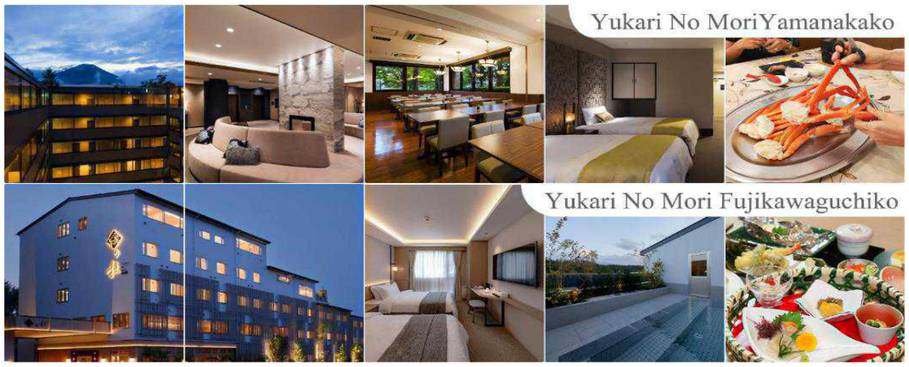
Yukari No Mori Yamanakako