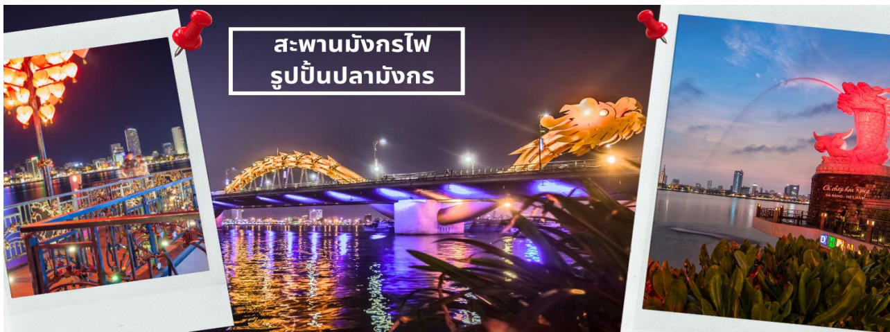
สะพานมังกรไฟ รูปปั้นปลามังกร

จากนั้นนำท่านชม สะพานแห่งความรัก ที่นิยมของหนุ่มสาวคู่รักกันมาซื้อกุญแจใส่คล้องใส่สะพาน จากนั้นนำท่านชม รูปปั้นปลามังกร ที่เป็นสัญลักษณ์ของเมืองดานัง เมืองที่กำลังจากปลากลายเป็นมังกร ในระยะใกล้ เชิญท่านเพลิดเพลินกับความอลังการของ สะพานมังกรไฟ ที่มีความยาวถึง 666 เมตร เป็นสะพาน 6 เลนส์ ซึ่งเป็นสะพานที่ตระการตามากที่สุดของเวียดนามในเวลานี้โดยการแสดงนี้จะเริ่มเวลา 21.00น. ของวันเสาร์และอาทิตย์เท่านั้น