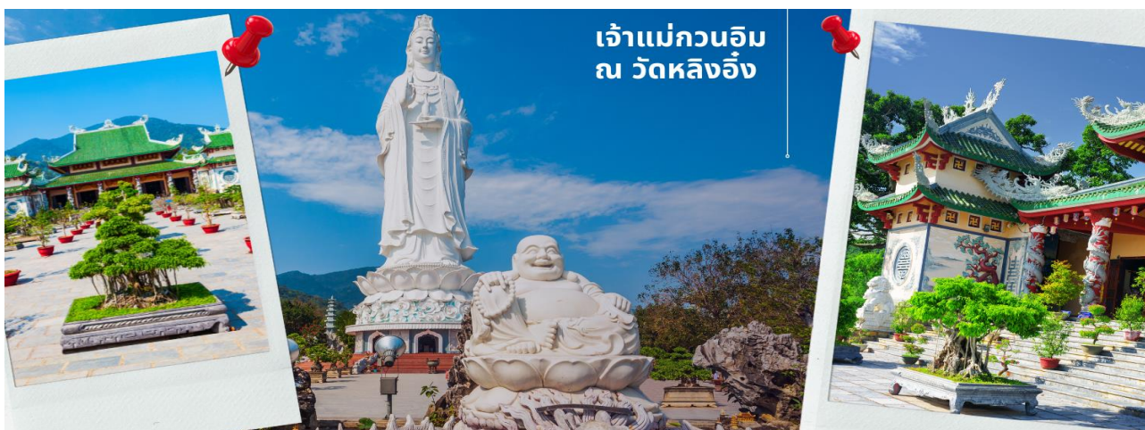
เจ้าแม่กวนอิม ณ วัดหลิงอิ่ง

นำท่านมัสการองค์ เจ้าแม่กวนอิม ณ วัดหลิงอิ่ง อยู่บนเกาะเซินตรา (Son Tra) ทางเหนือของเมือง ดานัง เป็นวัดใหญ่ที่สุดของที่นี่ รูปปั้นปูนขาวของเจ้าแม่กวนอิมยืนหันหลังให้ภูเขา หันหน้าออกสู่ทะเลเพื่อ เป็นการปกป้องคุ้มครองชาวประมงที่ออกไปหาปลา เสี่ยงระชังวัดที่ดีประสานกับเสียงคลื่นนั้นช่วยให้ ชาวเรือรู้สึกสงบ และสร้างขวัญกำลังใจอย่างดีเยี่ยม และเป็นที่เคารพนับถือของคนดานัง