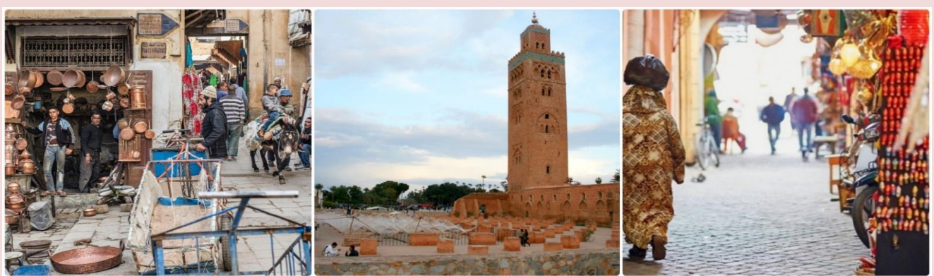
7 *ภาพใช้เพื่อการโฆษณาเท่านั้น*

ชม มัสยิด คูตูเบีย (KOUTOUBIA MOSQUE) ซึ่งเป็นมัสยิดใหญ่เก่าแก่ที่สุดในเมืองไม่ว่าจะเดินไปแห่งใดในตัวเมืองก็จะเห็นมัสยิดนี้ได้ จากหอคิวที่มีความสูง 226 ฟิต (70 เมตร) ไม่ว่าอยู่ที่ไหนในมาราเกช เราก็จะมองเห็นสุเหร่าแห่งนี้ อีสระให้ทางเก็บภาพเมืองมาราเกช เมืองที่ขึ้นชื่อว่ามีเสน่ห์ดึงดูดนักท่องเที่ยวติดอันดับโลก