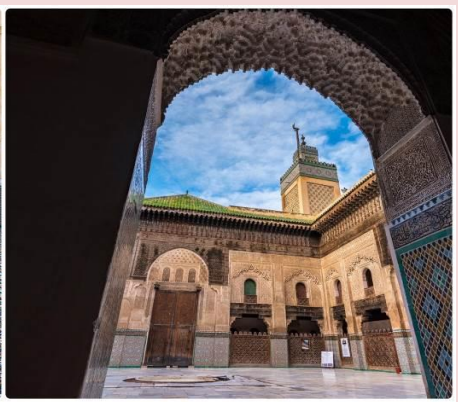
14 *ภาพใช้เพื่อการโฆษณาเท่านั้น*