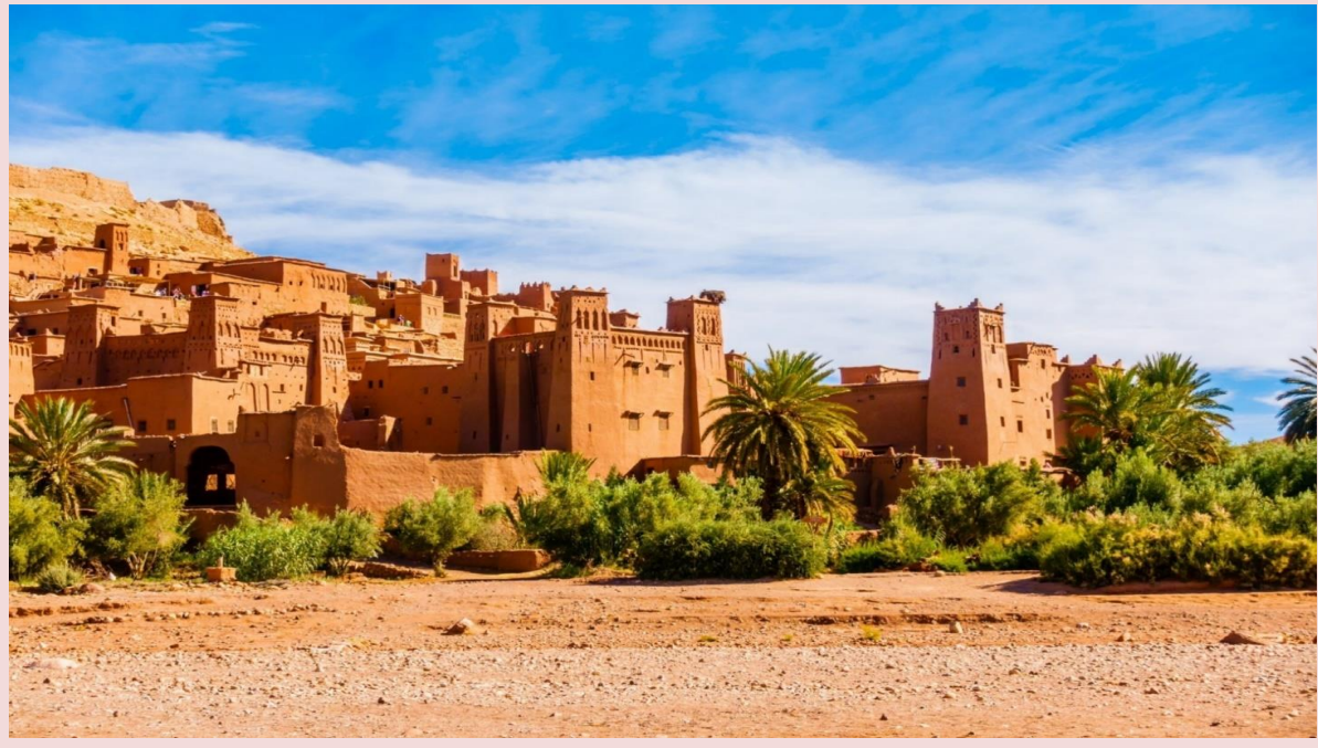
9 *ภาพใช้เพื่อการโฆษณาเท่านั้น*

จากนั้นเดินทางต่อ สู่เมืองวอซาเซท OUARZAZATE (ประมาณ 30 นาที ) ซึ่งเคยเป็นที่ตั้งทาง ยุทธศาสตร์ ในปี ค.ศ. 1928 ฝรั่งเศสตั้งกองกำลังทหารและพัฒนาที่นี่ให้เป็นศูนย์กลางการบริหาร ปัจจุบันเมืองวอซาเซทเป็นเมืองถูกส่งเสริมให้เป็นเมืองท่องเที่ยว และมีการพัฒนาพื้นที่ในทะเลทรายในการ ทำกิจกรรมต่างๆ ที่แวดล้อมไปด้วยสตูดิโอสำหรับการถ่ายทำภาพยนตร์ ไม่ว่าจะเป็น เรื่อง CLEO PATTRA, THE MUMMY, KINGDOM OF HEAVEN และอีกมากมายที่มักจะใช้เมืองแห่งนี้เป็นฉากสำหรับถ่ายทำใน ภาพยนตร์ ทั้งนี้เพราะลักษณะภูมิประเทศที่ยังคงความเป็นเอกลักษณ์แบบชนเผ่าเบอร์เบอร์ ซึ่งเป็นชนเผ่า ดั้งเดิมของชาวโมร็อกโก วอซาเซท อาจกล่าวได้ว่าเป็นจุดมุ่งหมายของนักท่องเที่ยวที่มองหาความแตกต่าง และการผจญภัยที่หาไม่ได้จากที่ไหน วอซาเซทเป็นเมืองที่สำคัญที่สุดของทางตอนใต้ และที่นี่ยังเป็นทาง เชื่อมระหว่างเหนือกับใต้ และตะวันออกกับตะวันตก ( โปรดเตรียมทิปเล็กน้อยให้แก่เจ้าหน้าที่โรงถ่าย / โรงถ่ายภาพยนตร์ )