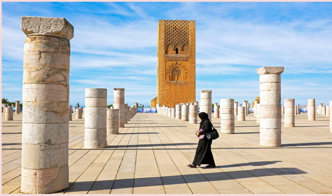
19 *ภาพใช้เพื่อการโฆษณาเท่านั้น*

นำท่านชม หอคอยยัสสัน ) หรือ สุเหร่าหลวง เป็นหนึ่งในสถาปัตยกรรมอันตระการตาของกษัตริย์โมอัมเหม็ดที่ 5 โดยหอคอยมีสูงถึง 44 ม. (140 ฟุต) ก่อสร้างมัสยิดเริ่มขึ้นในปี ค. ศ. 1191 ตั้งใจว่าหอคอยแห่งนี้จะกลายเป็นมัสยิดและสุเหร่าที่สูงที่สุดในโลก และเพื่อเฉลิมฉลองการบชนะของอัลมันซูร์ แต่ทว่าเมื่ออัลมันซูร์เสียชีวิตในปี 1199 การก่อสร้างมัสยิดก็หยุดลง