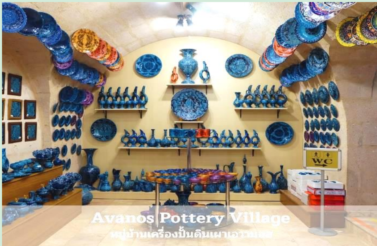
Avanos Pottery Village หมู่บ้านเครื่องปั้นดินเผาอวานอส

จากนั้นนำท่านแวะชม หมู่บ้านเครื่องปั้นดินเผาอวานอส (AVANOS) หมู่บ้านที่มีชื่อเสียงเกี่ยวกับเครื่องปั้นดินเผา อุปกรณ์ที่ใช้ภายในบ้าน ถ้วย,ชาม,ไห,โถ่ง,แจกันและเครื่องประดับบ้าน