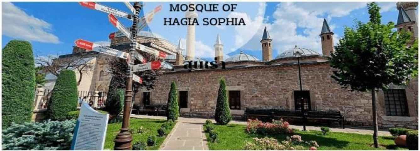
MOSQUE OF HAGIA SOPHIA

นำท่าน ท่องเที่ยวย่าน BALAT เป็นย่านที่เก่าแก่และสวยงามน่าตื่นตาตื่นใจเมื่อได้มาเยือน ตั้งอยู่ที่เมืองอิสตันบูล ประเทศตุรเคีย พื้นถนนปูด้วยหินก้อนโตๆ บ้านเรือนมีลักษณะเป็นตึก และมีสีส้มแจ่มจรัส แต่มีอายุมากกว่า 50 ปีมาแล้ว ซึ่งในบางหลังมีอายุกว่า 200 ปีที่นี่เป็นสถานที่ยอดนิยมเป็นอย่างมาก ปัจจุบันมีคาเฟ่และร้านอาหารมากมาย ตั้งอยู่ที่นี้