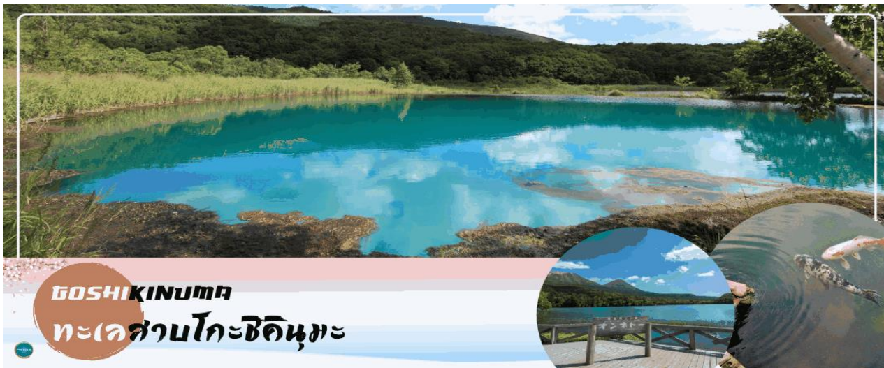
โกชิคินุมะ ทะเลสาบโกะชิคินุมะ

วันที่สาม เมืองฟุกุชิมะ – ทะเลสาบโกะชิคินุมะ – เมืองไอสุ – วัดเอ็นโซจิ – หมู่บ้านโออุจิ จุก – สถานีรถไฟยูโนดามิ ออนเซ็น – ปราสาทสิรุกะ (ด้านนอก)