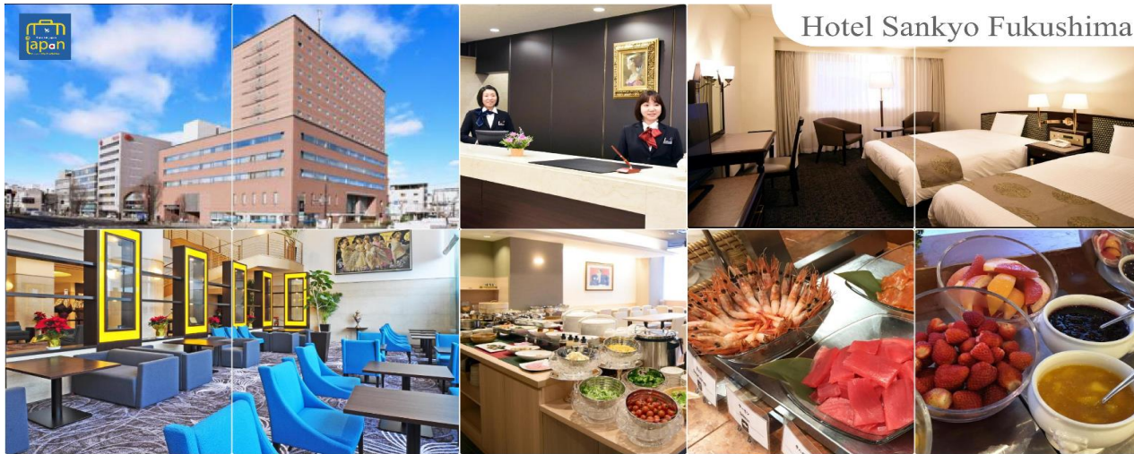
Hotel Sankyo Fukushima

เย็น รับประทานอาหารค่ำ ณ ภัตตาคาร (2) พักที่ HOTEL SANKYO FUKUSHIMA หรือเทียบเท่าระดับเดียวกัน