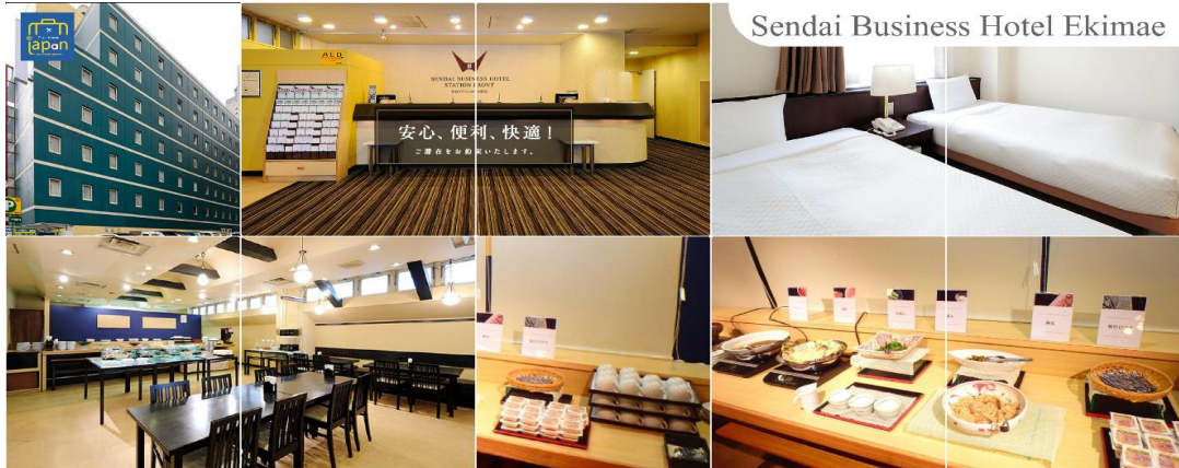
Sendai Business Hotel Ekimae

เย็นที่ฝึก อีสระรับประทานอาหารเย็นตามอัธยาศัย SENDAI BUSINESS HOTEL EKIMAE หรือเทียบเท่าระดับเดียวกัน