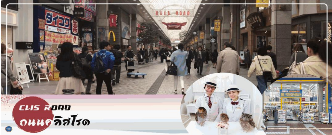
CLIS ROAD ถนนคิสิโรด

จากนั้นนำท่านสู่ ถนนคิสิโรด (Clis Road) ถนนสายช้อปปิ้งที่ใหญ่ที่สุดของเมือง มีสินค้าให้เลือกหลากหลายตั้งแต่อาหารท้องถิ่นหรือฟาสต์ฟู้ด ร้านคาเฟ่เก๋ๆ ศูนย์เกมส์ ไปจนถึงแบรนด์เนมระดับไฮเอน HIGHLIGHT!!! สำหรับย่านนี้คือ คาเฟ่คนซุกฟูโระ (Fukuro Café) ตั้งอยู่ติดที่อยู่หลังร้าน Gucci มีค่าเช่า 1,200 เยน ซึ่งราคานี้รวมกับค่าเครื่องดื่มแบบไม่อื่น โดยจะมีคนซุกฟูที่ถูกฝึกจนเชื่องอยู่หลากหลายสายพันธุ์ แต่ละตัวล้วนมีความน่ารักที่ต่างกันไป ที่สำคัญยังสามารถลูบหรือจับได้ภายใน การดูแลของพนักงานผู้ชำนาญการ อีสระให้ท่านช้อปปิ้งตามอัธยาศัย