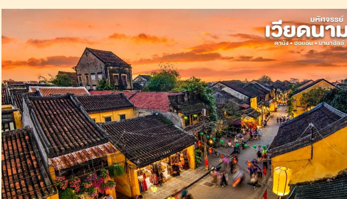
บริษัท ไลออน ทราเวล จำกัด เวียดนาม ดานัง • ฮอยอัน • บานาฮิลล์

** ชำระค่าทัวร์ในนามบริษัท ไลออน ทราเวล จำกัด เท่านั้น **