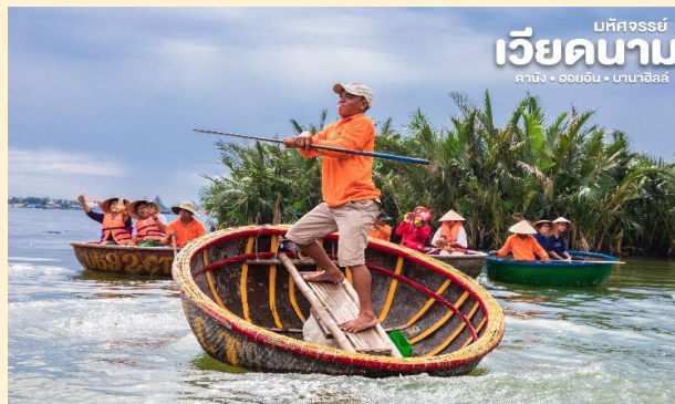
บริษัท ไลออน ทราเวล จำกัด เวียดนาม ดานัง • ฮอยอัน • บานาฮิลล์

ล่องเรือท่านจะได้ชมวัฒนธรรมอันสวยงาม ชาวบ้านจะขับร้องเพลงพื้นเมือง ผู้ชายกับผู้หญิงจะหยอกล้อกันไปมาหน้าที่พายเรือมาเคาะกันเป็นจังหวะดนตรีสุดสนุกสนาน (ไม่รวมค่าทิปคนพายเรือ ท่านละ 40 บาท/ต่อท่าน/ต่อทริป)