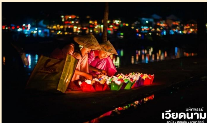
เวียดนาม มหิศจรรย์ ดานัง • ฮอยอัน • บานาฮิลล์

BT-DAD86_VZ_APR - OCT 2024 DANANG HOIAN BANAHILLS NON-SHOP