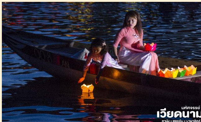
เวียดนาม มหิศจรรย์ ดานัง • ฮอยอัน • บานาฮิลล์

ที่พัก เข้าสู่ที่พัก TTC HOI AN 4* หรือเทียบเท่ามาตรฐานเวียดนาม (โรงแรมที่ระบุในรายการทัวร์เป็นเพียงโรงแรมที่นำเสนอเบื้องต้นเท่านั้น ซึ่งอาจมีการเปลี่ยนแปลงแต่โรงแรมที่เข้าพักจะเป็นโรงแรมระดับเทียบเท่ากัน)