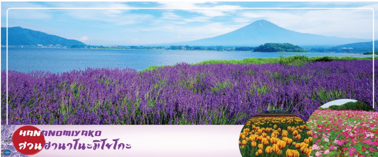
HANANOMIYAKO สวนसानะโนะมียาโกะ

วันที่สาม เมืองยามานาชิ – สวนดอกไม้सानะโนะมียาโกะ หรือ เทศกาลชมดอกลาเวนเดอร์ที่ทะเลสาบคาวากุจิ (ตามฤดูกาล) – พิพิธภัณฑ์ญี่ปุ่น – กรุงโตเกียว – ย่านโอไดบะ – ห้างไดเวอร์ซิตี – เมืองนาริตะ – อีออนมอลล์ นาริตะ