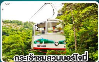
กระเช้าชมสวนบอร์โจมี