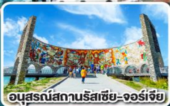
อนุสรณ์สถานรัสเซีย-จอร์เจีย