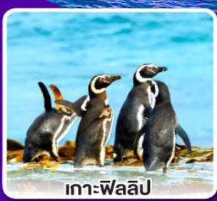
เกาะฟลิลิป

กั๊ปลือบสตาตร์ท่านละ 1 ตัว พร้อมไวน์ชั้นเยี่ยม