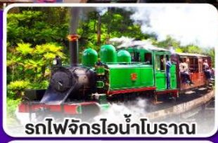
รถไฟจักรไอน้ำโบราณ