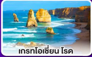
เกรทโอเซียน ไรด์